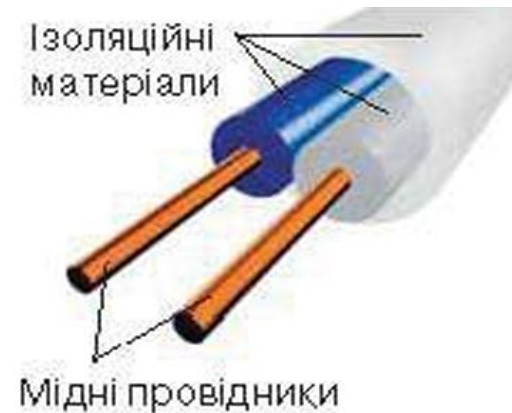
Мал. 168. Будова електричного дроту