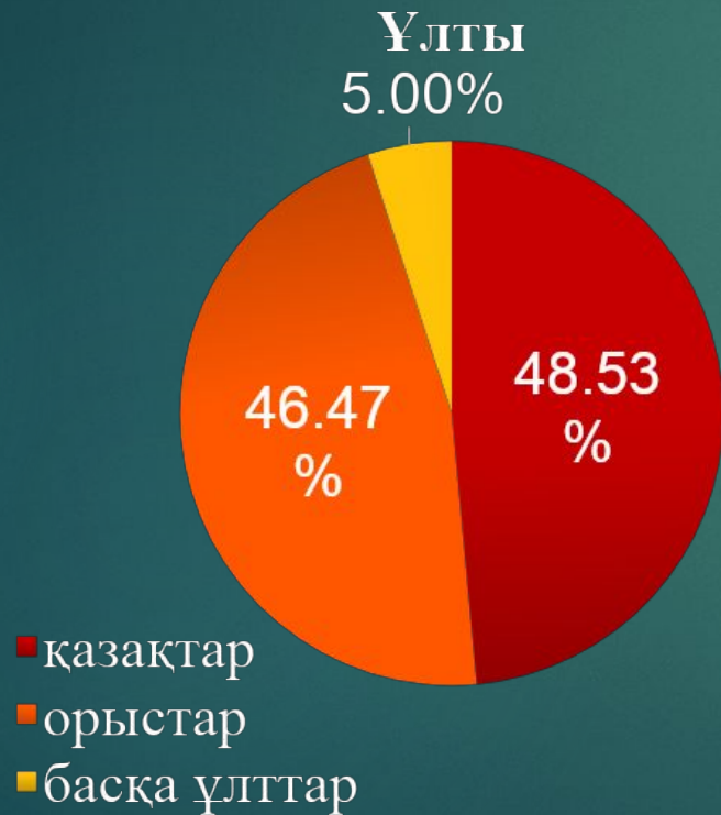
Ақбұлақ қаласының жалпы континент сипаттамасы