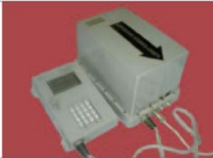
Лазерный гироскоп 9A184

Лазерные гироскопы второго типа чрезвычайно перспективны.