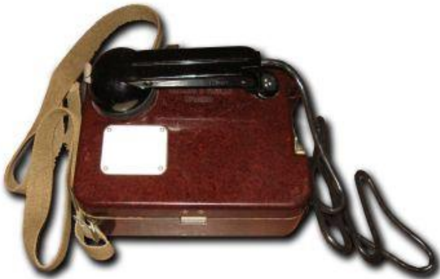
Телефонний апарат ТА-57 у розгорнутому стані.