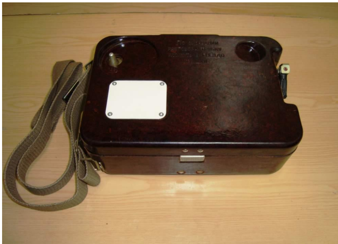
Телефонний апарат ТА-57. Зовнішній вигляд

Польовий телефонний апарат ТА-57 призначений для забезпечення телефонного зв'язку у військах по польовим кабельним лініям, а також для забезпечення дистанційного управління радіостанціями.