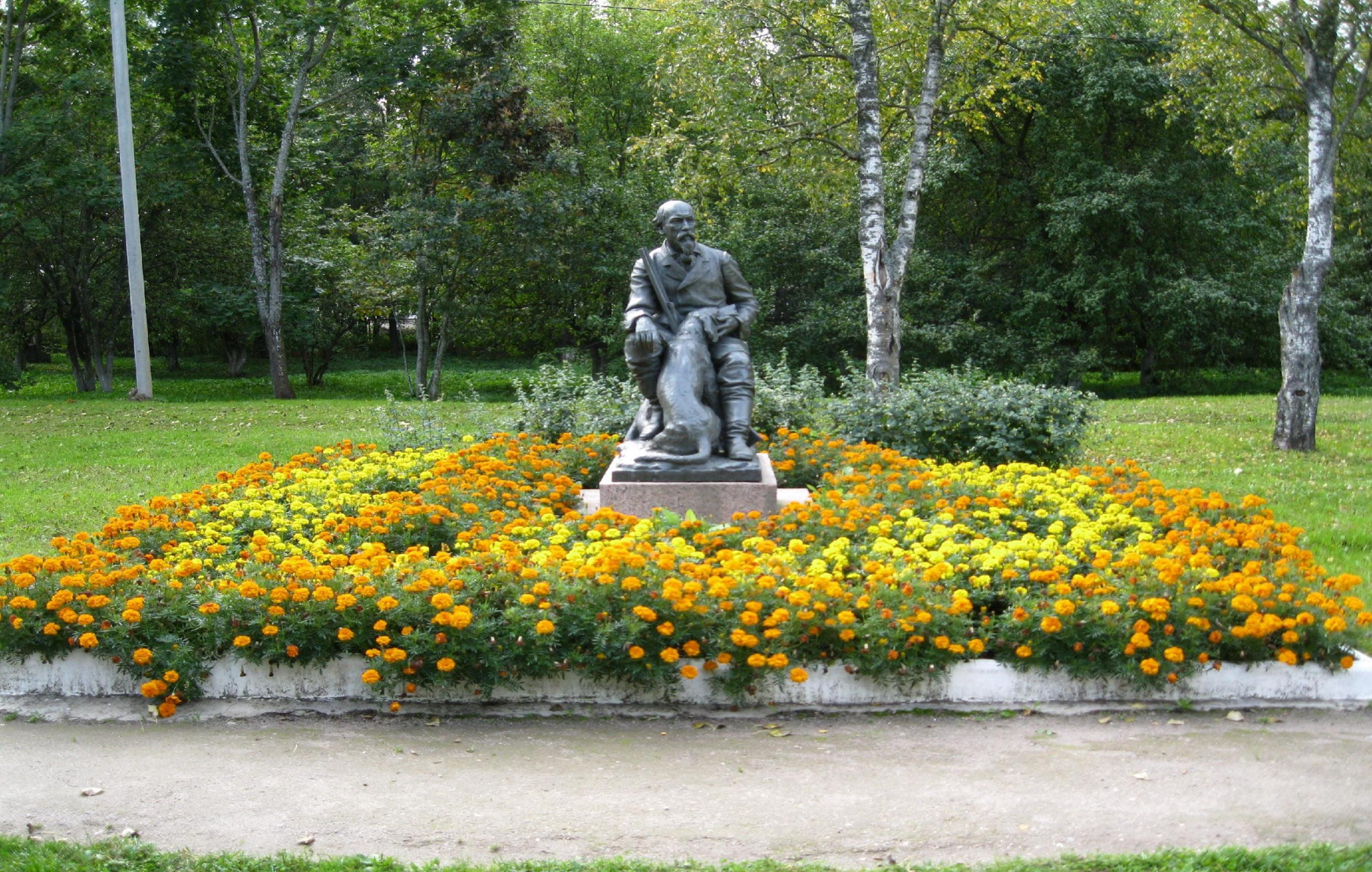
Памятник Некрасову с собакой и ружьём в Чудово, рядом с домом-музеем — бывшим охотничьим домиком Н. А. Некрасова.