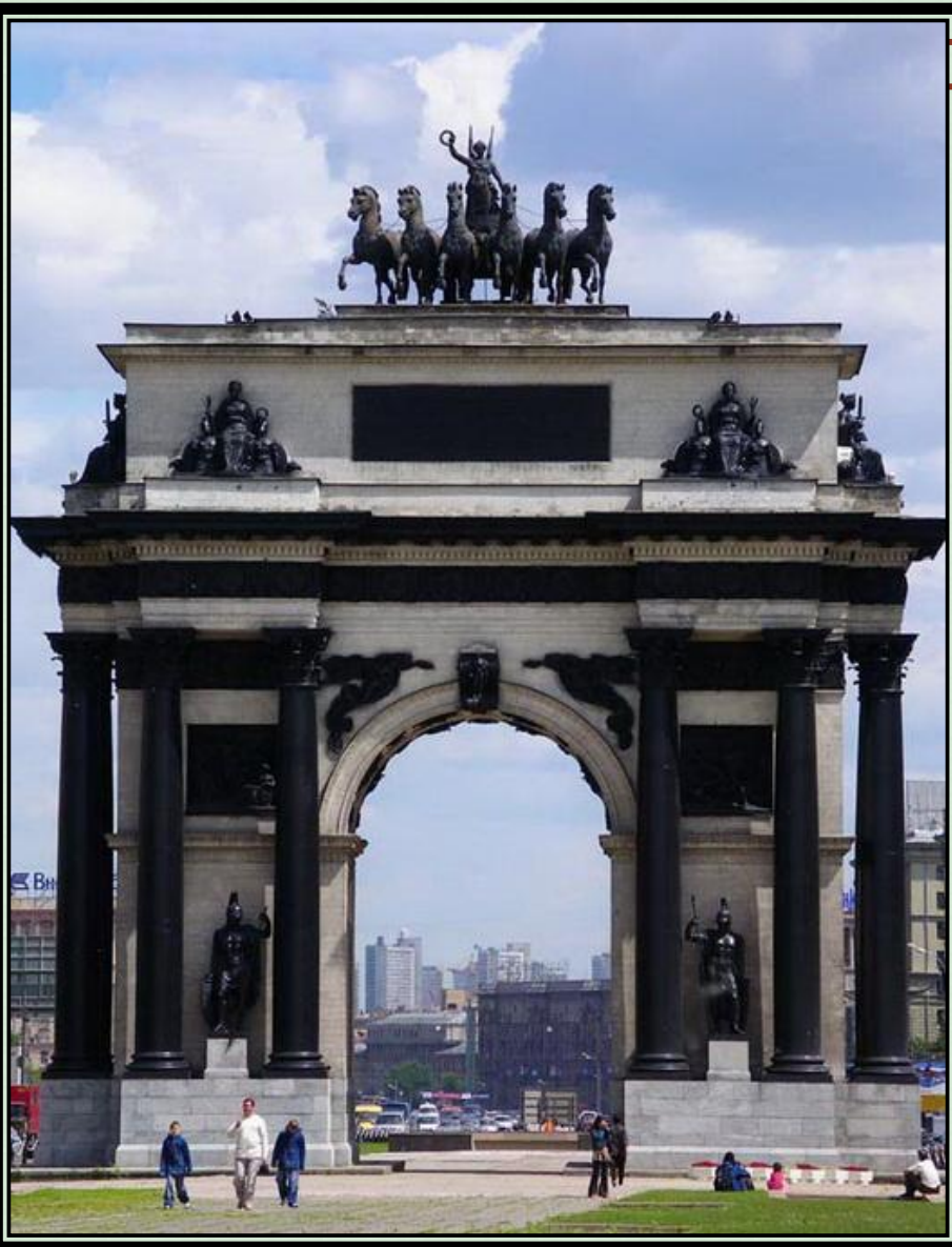
Триумфальные ворота в Москве.

Художник работал в тесном контакте с зодчими В.В. Растрелли, М.Г. Земцовым и декоратором Дж. Валериани, участвовал в бесконечных перестройках, в реставрациях и новом строительстве Зимнего, Летнего и Аничкового дворцов, Триумфальных ворот в Москве, Петропавловского собора, оперных домов, Петергофского и Царскосельского дворцов.