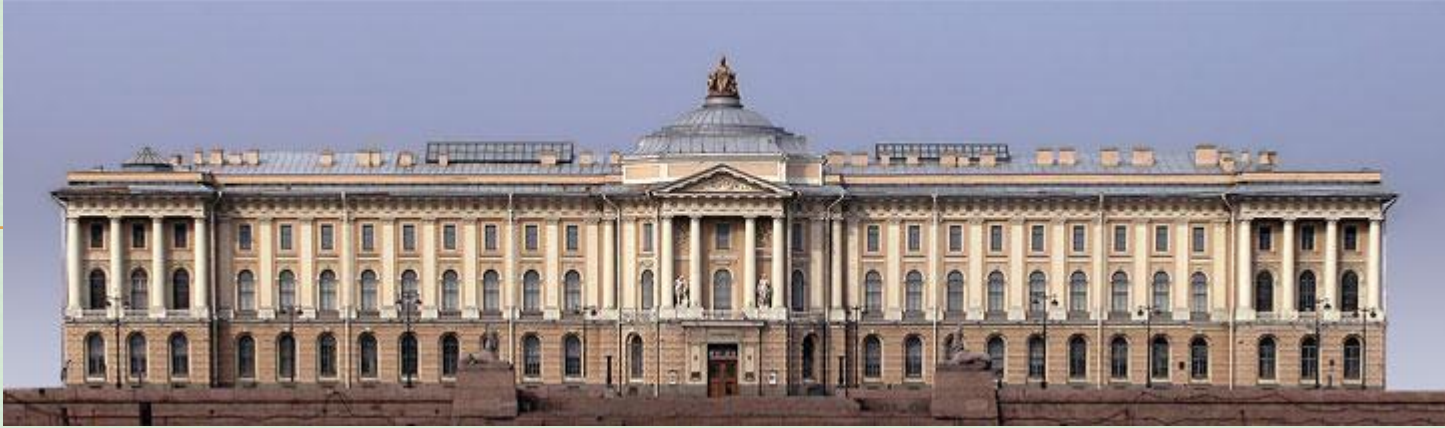
Академия художеств, Санкт-Петербург