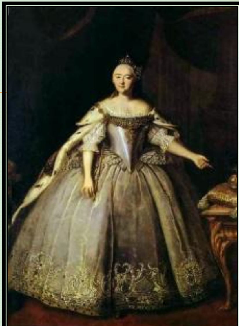
Портрет Елизаветы Петровны. 1743г, холст, масло, 255 x 180 см Государственная Третьяковская галерея, Москва

□ Художнику нравилась декоративная роскошь парадных нарядов его эпохи, их театральность и праздничность. Он с любовью выписывает изумительные костюмы XVIII столетия, с их тканями со сложными узорами, различных расцветок и фактур, с тончайшими вышивками и кружевами и украшениями.. И хотя узор словно наложен поверх негнущихся складок одежды, он напоминает «поле роскошной древнерусской миниатюры XVII в. или растительный орнамент фрески того времени». А над всем этим богатством вещного мира смотрят и дышат лица людей