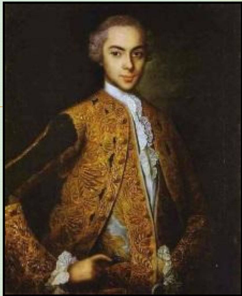
Портрет молодого человека. ~1750г, холст, масло, Львовская картинная галерея, Украина

Вишняков никогда не выезжал из России, не погружался в иную художественную среду, как его современники, поэтому в его портретах, особенно детских, отразился дух русского искусства в стиле рококо, но в них нет бездушности, фривольности, наружной слащавости и галантности, присущих западному рококо.