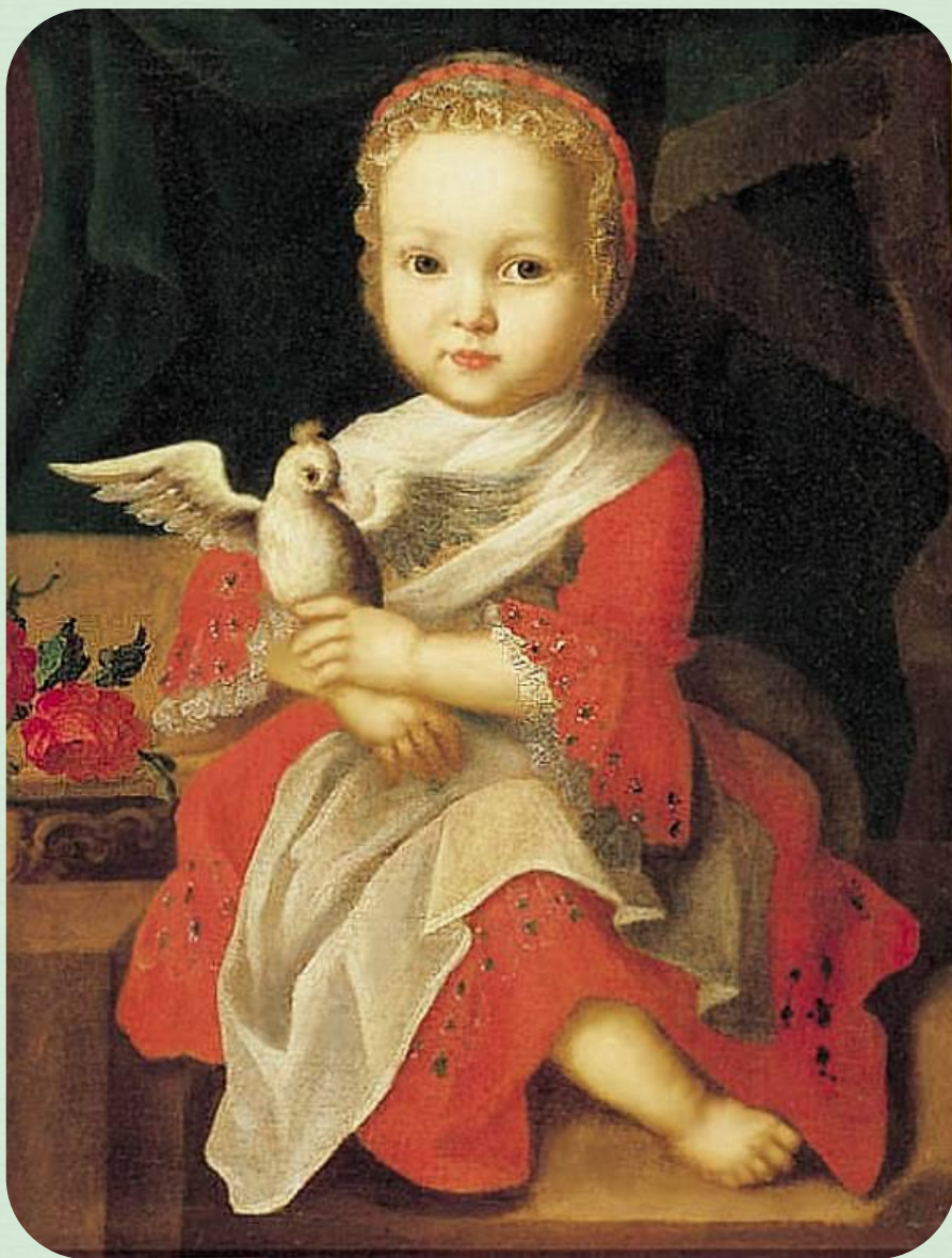
Девочка с птичкой. Холст, масло, Государственная Третьяковская галерея, Москва.

Впервые это полотно неизвестного художника было показано в 1912 году в Петербурге, на выставке "Ломоносов и елизаветинское время". Предположительно, картина написана И.Я. Вишняковым. После революции "Девочка с птичкой" исчезла. Затем ее увидели у одного москвича и купили. Декоративно исполненный портрет с красным платьем на темном фоне и пышной розой, возможно, донес до нас черты малолетней дочери сенатора Пуговишниковова.