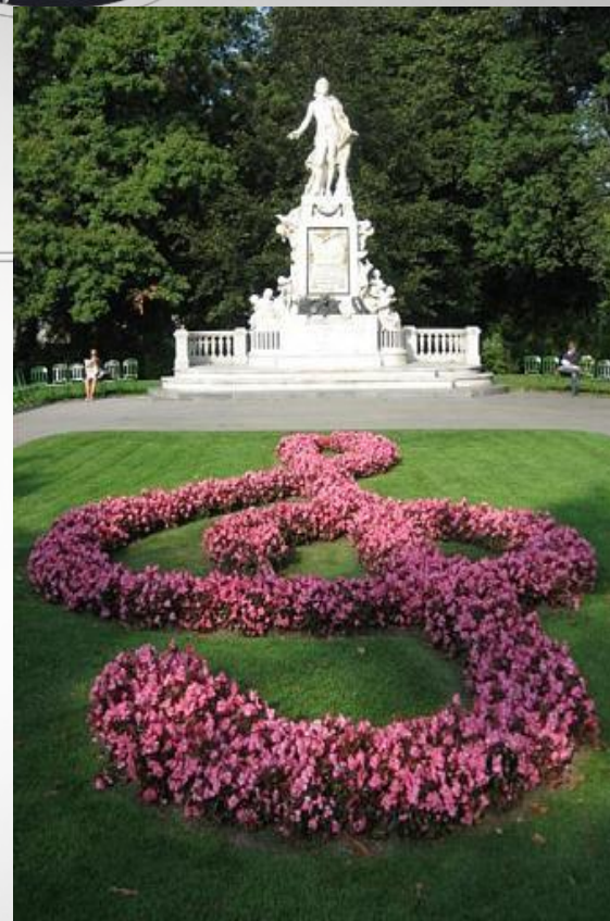
Пам'ятник Моцарта у Відні