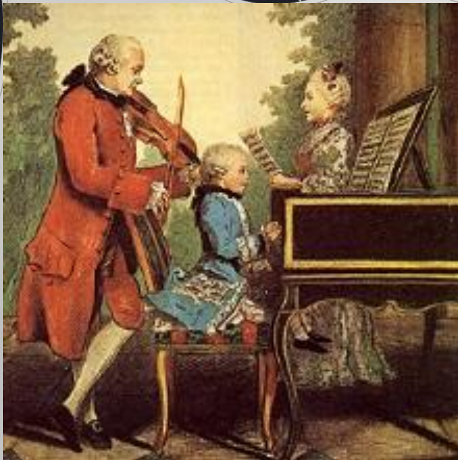
Моцарт з родиною