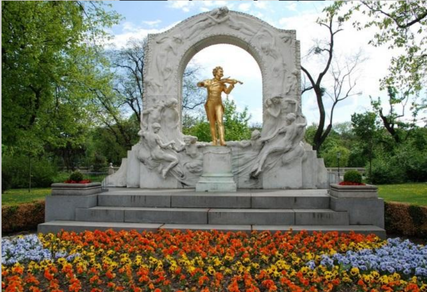
ПАМ'ЯТНИК ЙОГАНУ ШТРАУСУ (СИНУ) У ВІДНІ