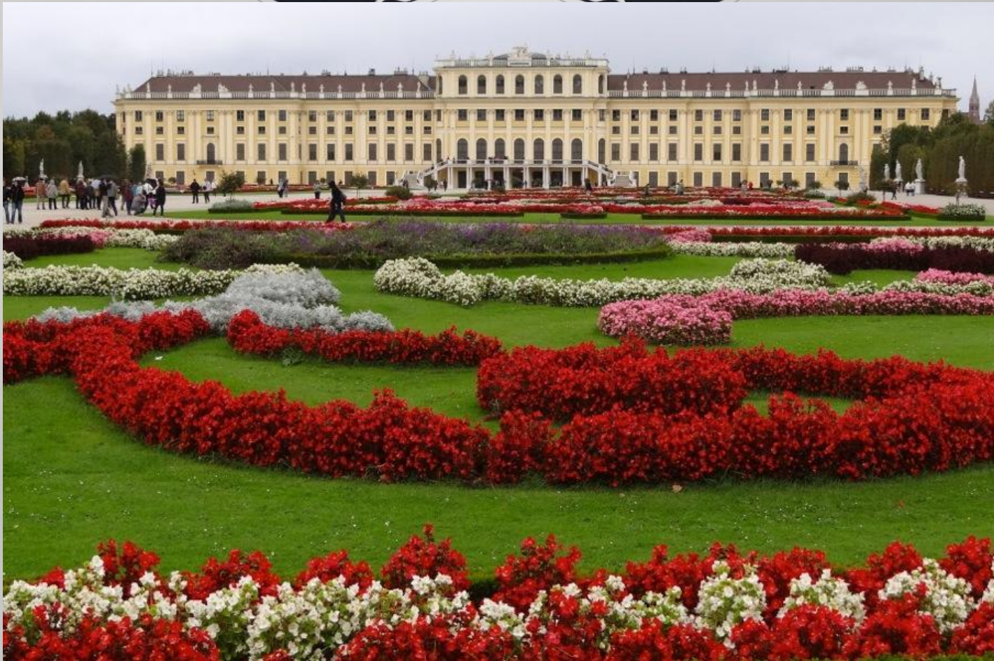
ПАЛАЦ ШЕНБРУНН - НАЙБІЛЬШ ВІДВІДУВАНА ПАМ'ЯТКА АВСТРІЇ