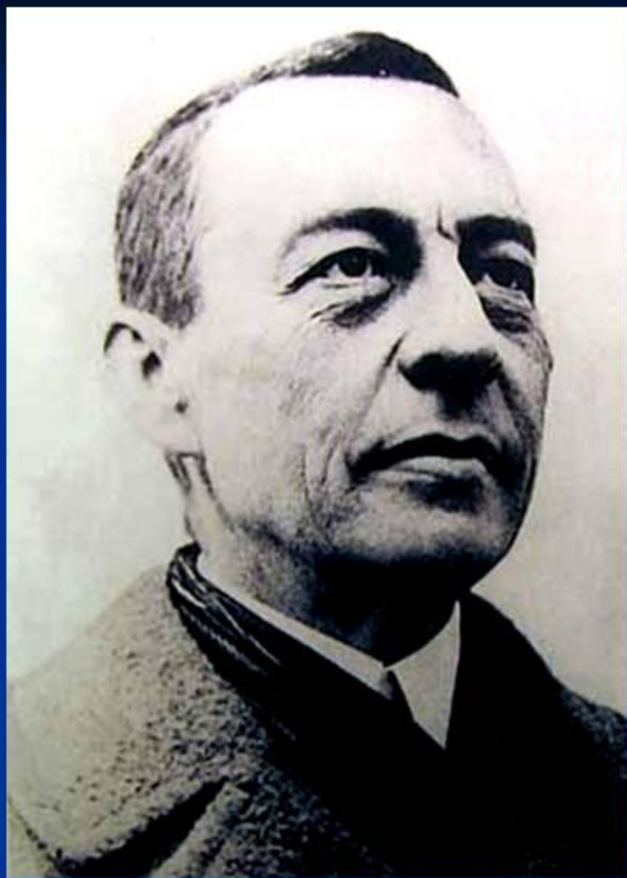
Рахманинов Сергей Васильевич (1873–1943) русский композитор, пианист, дирижёр.