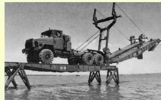
Механізований міст ТММ-3М1 на шасі КрАЗ-260Г с удлинненними колійними блоками.