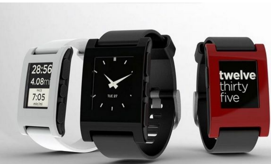
Розумний годинник Pebble