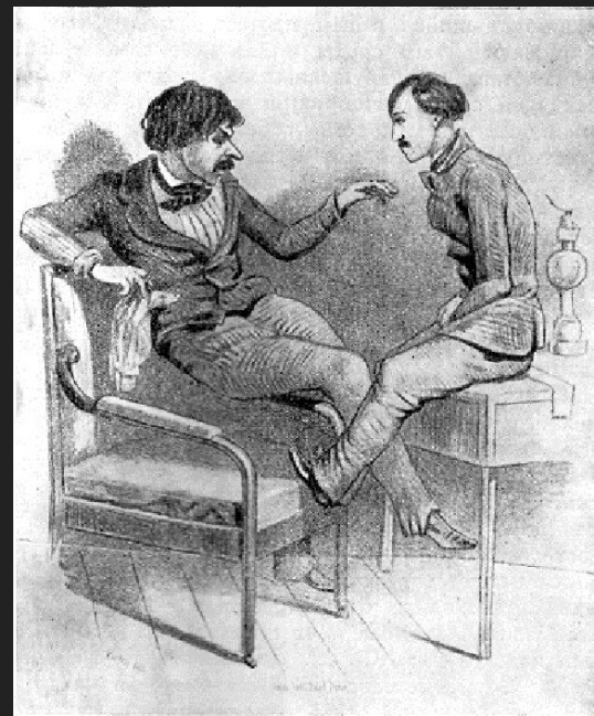
Панаев и Некрасов. Карикатура.

Что и вовсе было удивительным их «любовь на троих» была достаточно длительной - почти 16 лет, до самой кончины Панаева. Вся эта история вызывала всеобщее негодование и людские кривотолки. О Некрасове говорили, что «он живёт в чужом доме, любит чужую жену и при этом ещё и закатывает сцены ревности законному мужу» . А острые на сатиру карикатуристы частенько зло шутили над этой троицей в своих карикатурах.