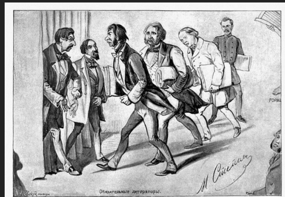
Карикатура на авторов журнала «Современник».

Однако молодой и настойчивый поэт никак не хотел сдавать свои позиции перед жизнью, и новой вехой в его творческой жизни станет сотрудничество в литературном журнале «Отечественные записки», где сблизится с Белинским, Достоевским и Григоровичем, подружится с ними.