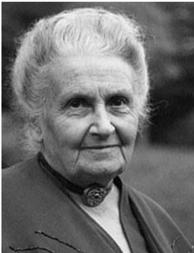
Методика Марии Монтесори