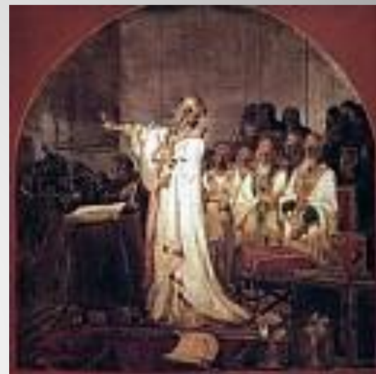
Третий Вселенский Эфесский Собор. 1876