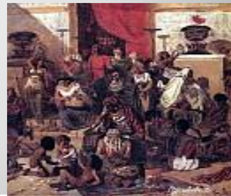
Изгнание Христом торгующих из храма. 1873