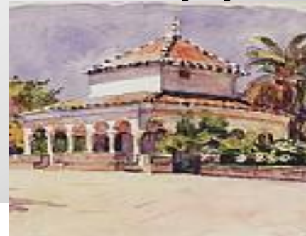
Севиля. Альказар. 1910