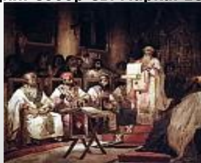
Второй Вселенский Константинопольский Собор. 1876