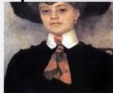
Женский портрет. 1902