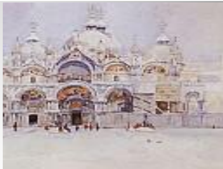
Венеция. Собор Св. Марка. 1884