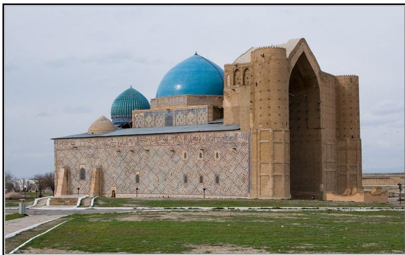
Мавзолей Ходжа Ахмета

С момента принятия государственной программы «Культурное наследие» по настоящее время завершены реставрационные работы на 78 памятниках истории и культуры проведены 26 научно-прикладных, 40 археологических исследований, которые обогатили науку тысячами артефактов, дающих представление об истории наших предков.