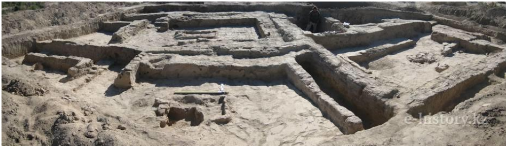
городище Жанкент(резиденция «царя гузов»)

Всего с 2004 года – начала реализации программы «Культурное наследие» – проведено 40 археологических исследований, которые обогатили науку тысячами артефактов, дающих представление об истории наших предков.