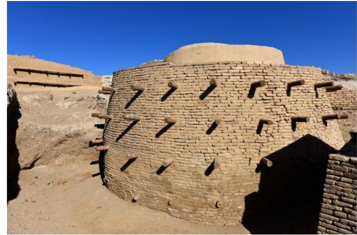
городище Отрар(городской квартал XVI в)