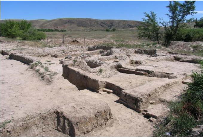
Средневековый Каялык (Койлык)