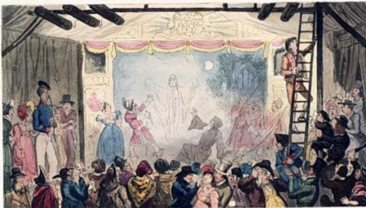
ТОМ. ЖЕКУ, БОСИС. and the illustration by William Turner, the artist of the British Royal Academy.

Петербурге во времена Елизаветы существовали театры в доме Ягужинского и Шереметева. Этот обычай богатых вельмож заводить у себя постоянные домашние театры сохранялся очень долго. Так при Екатерине II славились театры Румянцева, Волконского, у графа Шереметева было целых четыре театра (в Петербурге, Москве и имениях Кусково и