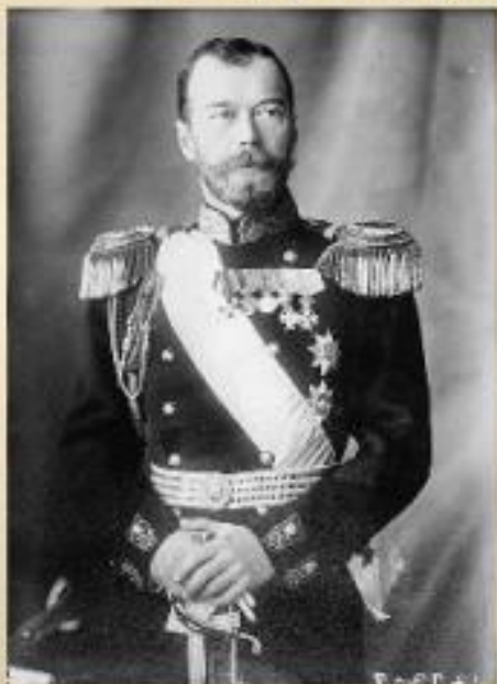
Император Николай II

1 августа (19 июля по ст. ст.) Германия объявила войну России