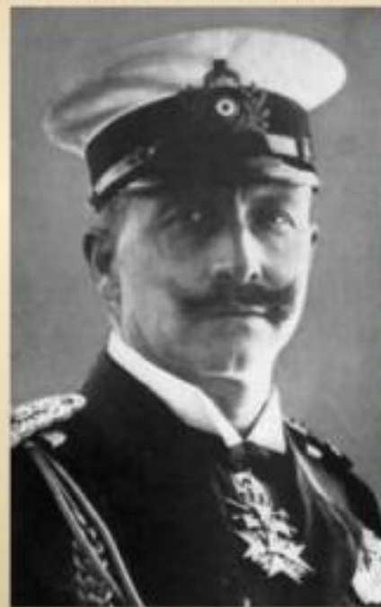
Император Вильгельм II