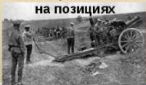
Русские артиллеристы в Галиции