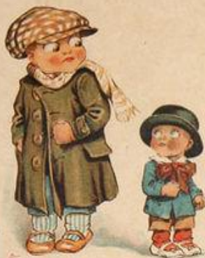
Большевикъ и меньшевикъ.