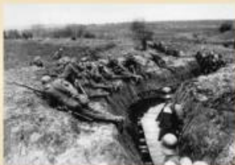
Немецкие войска на позициях