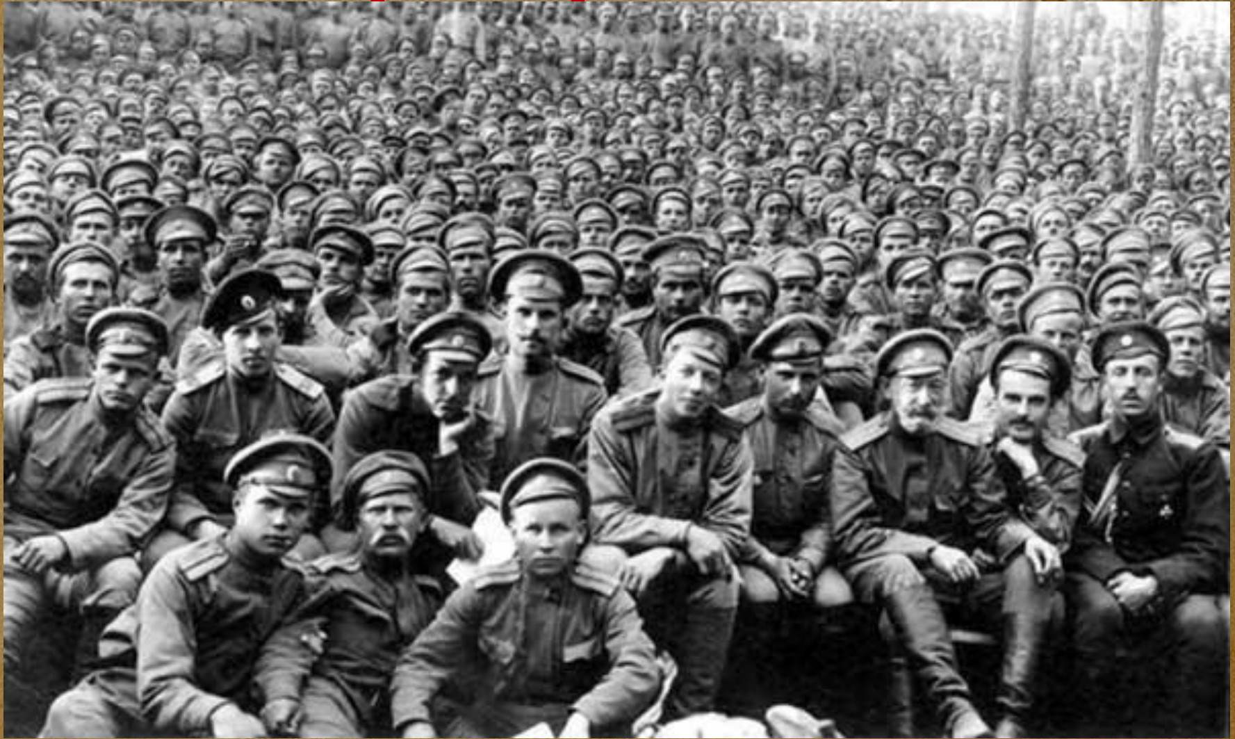
Рисунок 2. Российские солдаты и офицеры Первой мировой войны