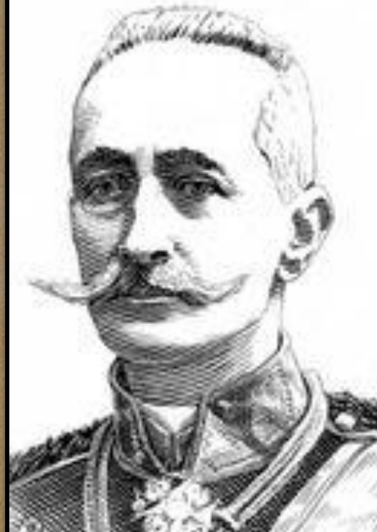
Брусилов А.А. (1853-1926)

Главным успехом нашей армии в годы Первой мировой войны можно считать «брусиловский прорыв», когда в ходе стратегического наступления в мае 1916 года, организованного талантливым военачальником генералом А.А. Брусиловым, основные силы австро-венгерской армии были разгромлены. Но этот успех не повлиял на ход дальнейших боевых действий со стороны нашей страны.