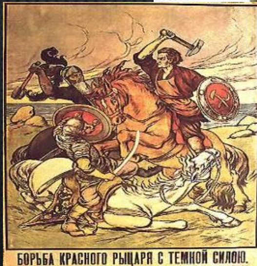
БОРЬБА КРАСНОГО РЫЦАРЯ С ТЕМНОЙ СИЛОЮ.