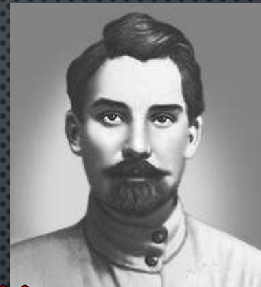
Буденный Сталин Тухачевский Щорс