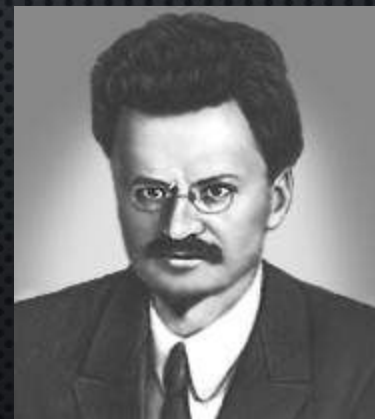
Чапаев Ворошилов Фрунзе Троцкий