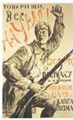
П. Киселис. Плакат «Товарищи, все на Урал!»