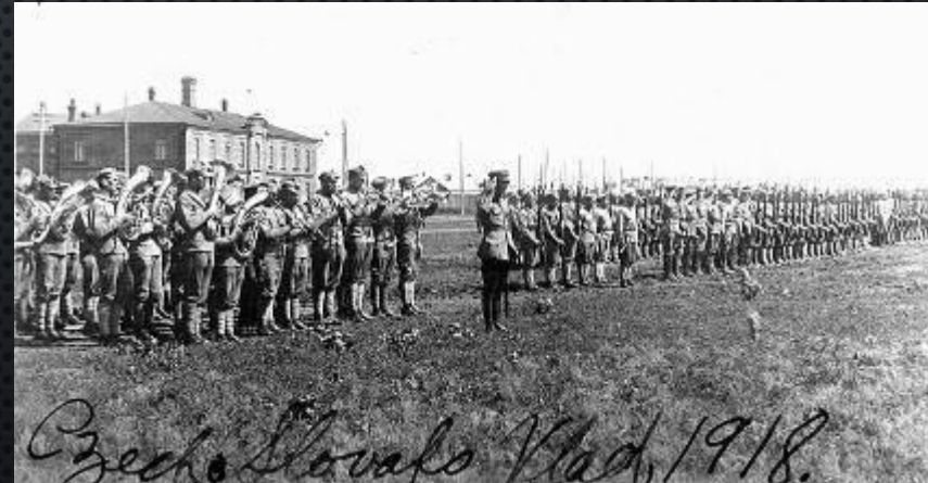
Чехословацкий корпус во Владивостоке.