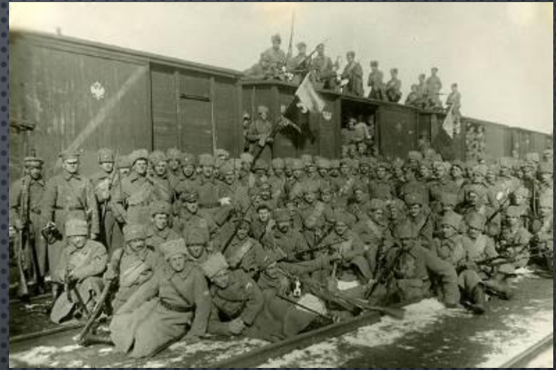
Бойцы 5-го полка Чехословацкого корпуса на захваченном ими вокзале в Пензе. Май, 1918 г.

25 мая мятеж начался в Мариинске, совместно с эсеров-белогвардейскими отрядами чехословацкие войска захватили ряд городов, где находился золотой запас Республики.