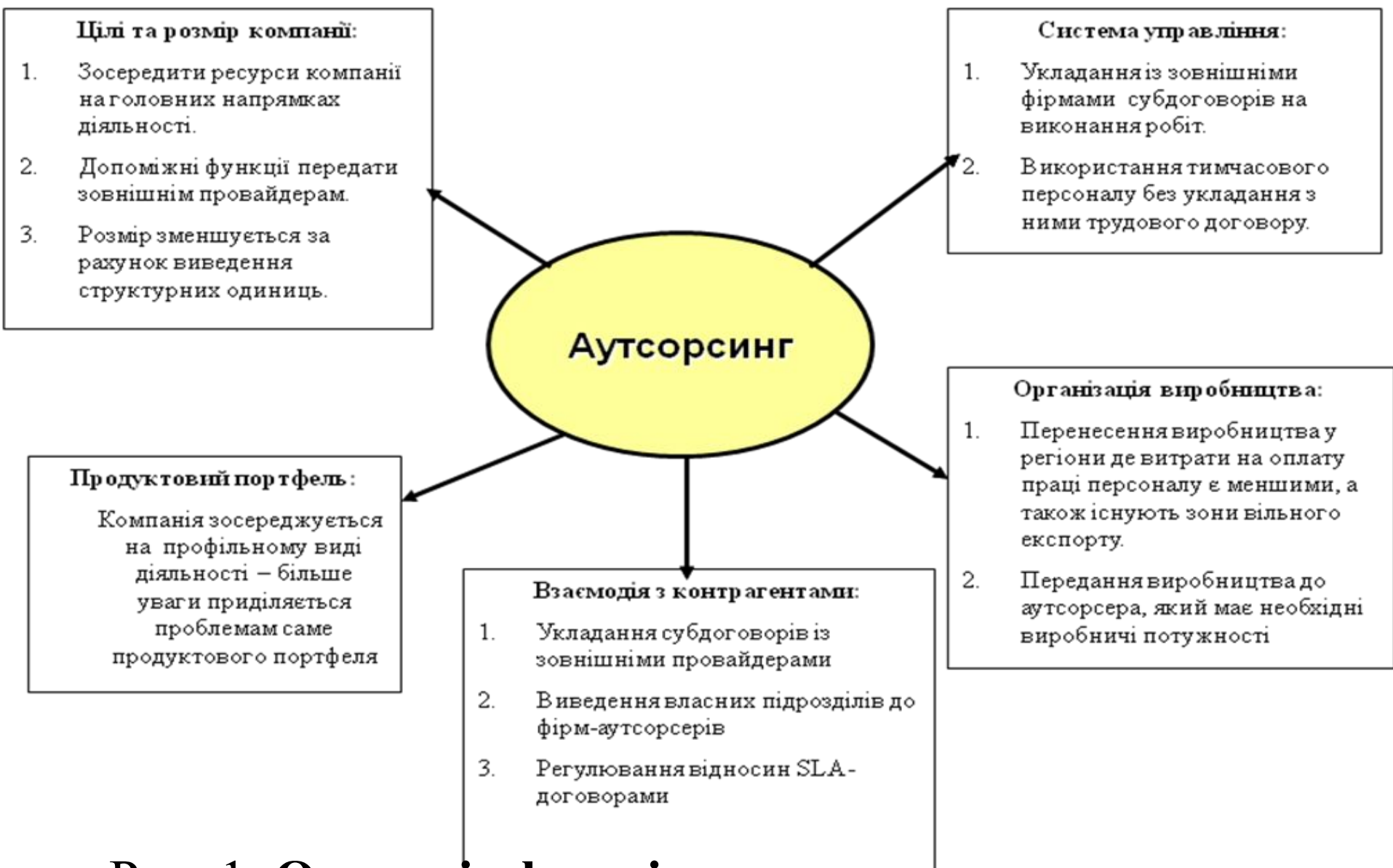
Рис. 1. Основні сфери і напрямки використання аутсорсингу