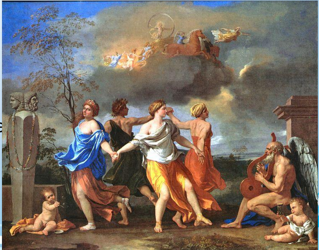
Никола Пуссен «Танец под музыку времени» (1636).

от лат. classicus — «образцовый»-художественное направление в европейском искусстве XVII — XIX вв., ориентированное на идеалы античной классики.