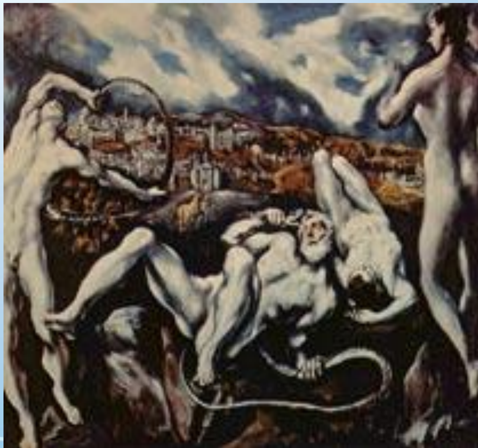
Эль Греко "Лаокоон", 1604-1614

Маньеризм охватывал различные виды художественного творчества – архитектуру, живопись, скульптуру, декоративно – прикладное искусство.