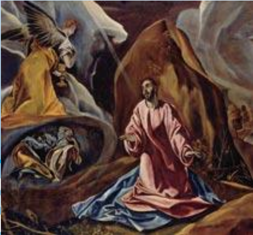
Эль Греко "Христос на Масличной Горе", 1605. Национ. гал., Лондон

Маньеризм (итал. manierismo, от maniera — манера, стиль), направление в западноевропейском искусстве 16 в., отразившее кризис гуманистической культуры Возрождения. Внешне следуя мастерам Высокого Возрождения, произведения маньеристов отличаются усложненностью, напряженностью образов, манерной изощренностью формы, а нередко и остротой художественных решений .