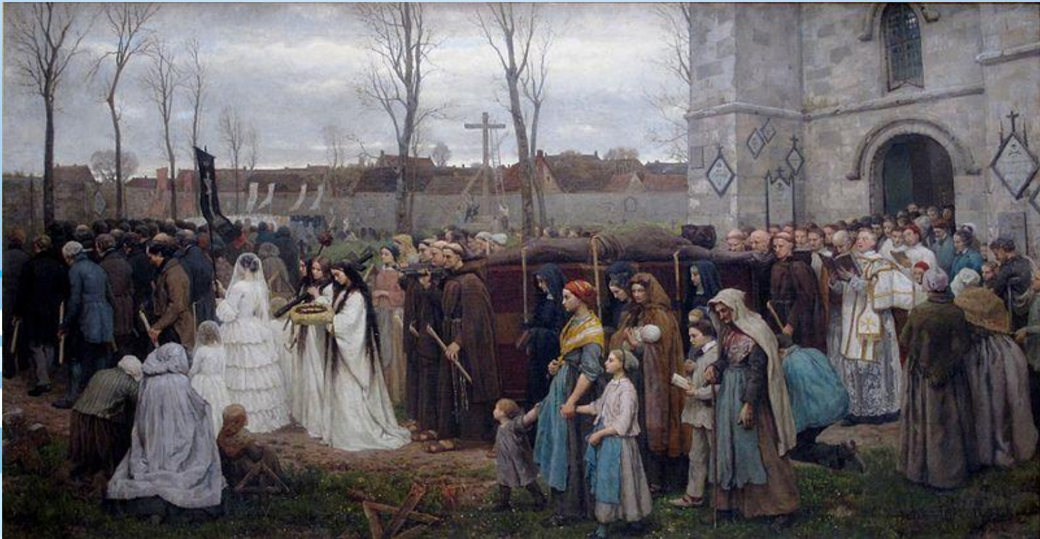
Жюль Бретон. «Религиозная церемония»

Реализм (фр. réalisme , от позднелат. reālis «действительный», от лат. rēs «вещь») — эстетическая позиция, согласно которой задача искусства состоит в как можно более точной и объективной фиксации действительности. Термин «реализм» впервые употребил французский литературный критик Ж. Шанфлёр в 50-х гг.