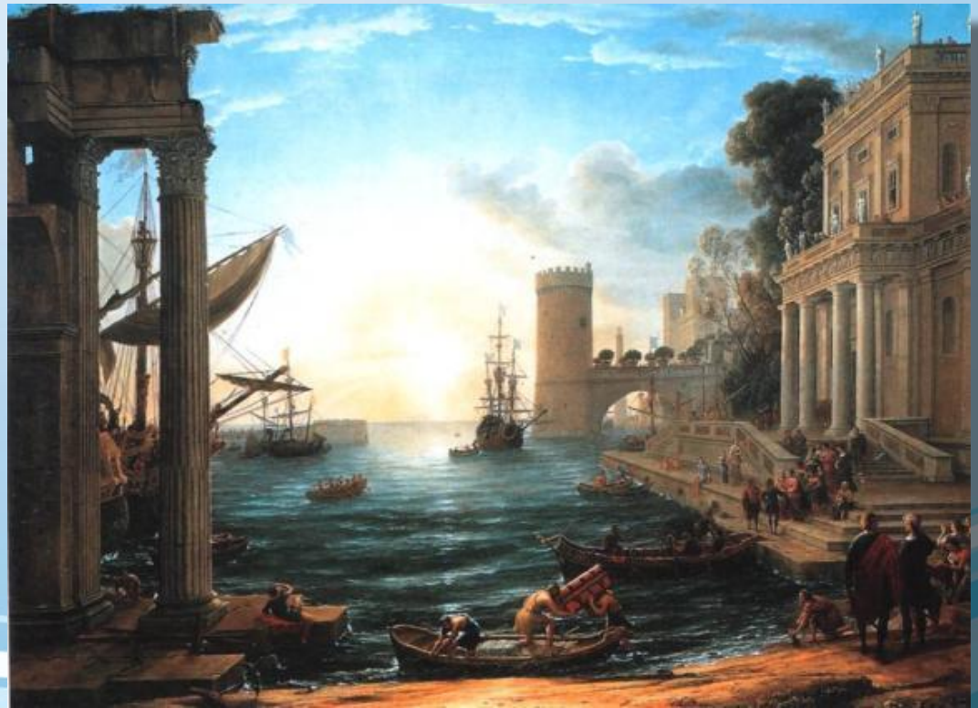
Клод Лоррен «Отплытие царицы Савской»

В живописи главное значение приобрели логическое развертывание сюжета, ясная уравновешенная композиция, четкая передача объема, с помощью светотени подчиненная роль цвета, использование локальных цветов .