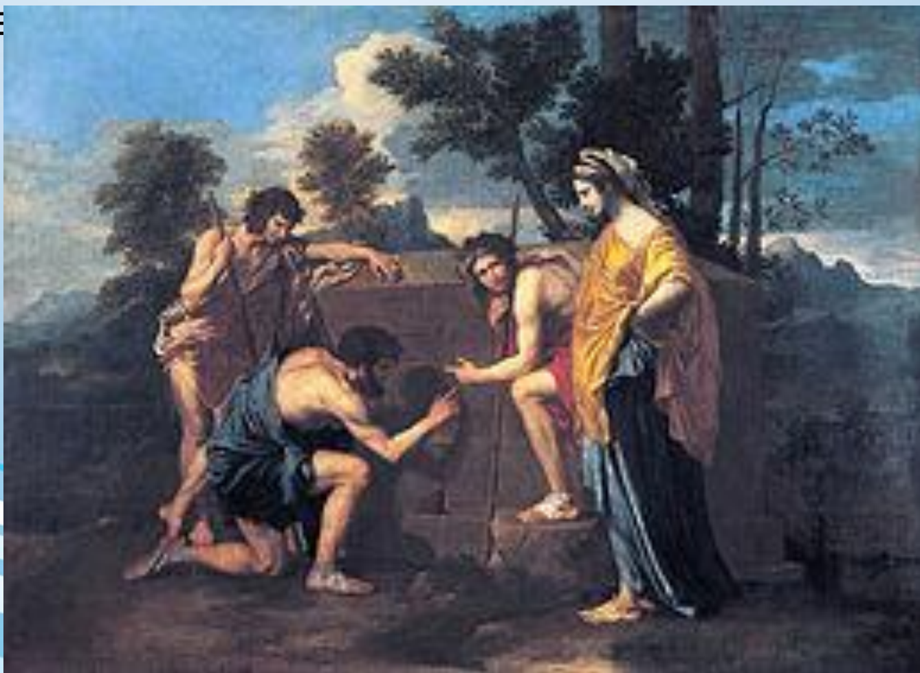
Н. Пуссен «Пастухи Аркадии».1638 -1639 гг. Лувр, Париж

Главными темами искусства классицизма были торжество общественных начал над личными, подчинение чувства долгу, идеализация героических образов