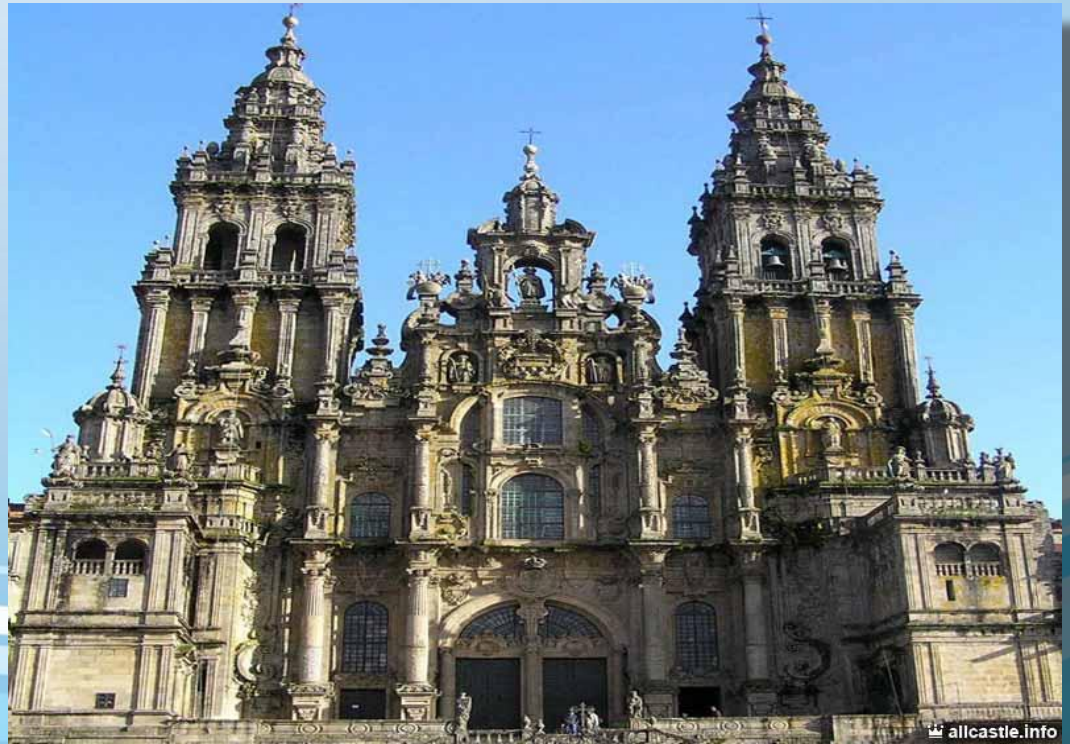
Кафедральный собор Сантьяго-де-Компостела