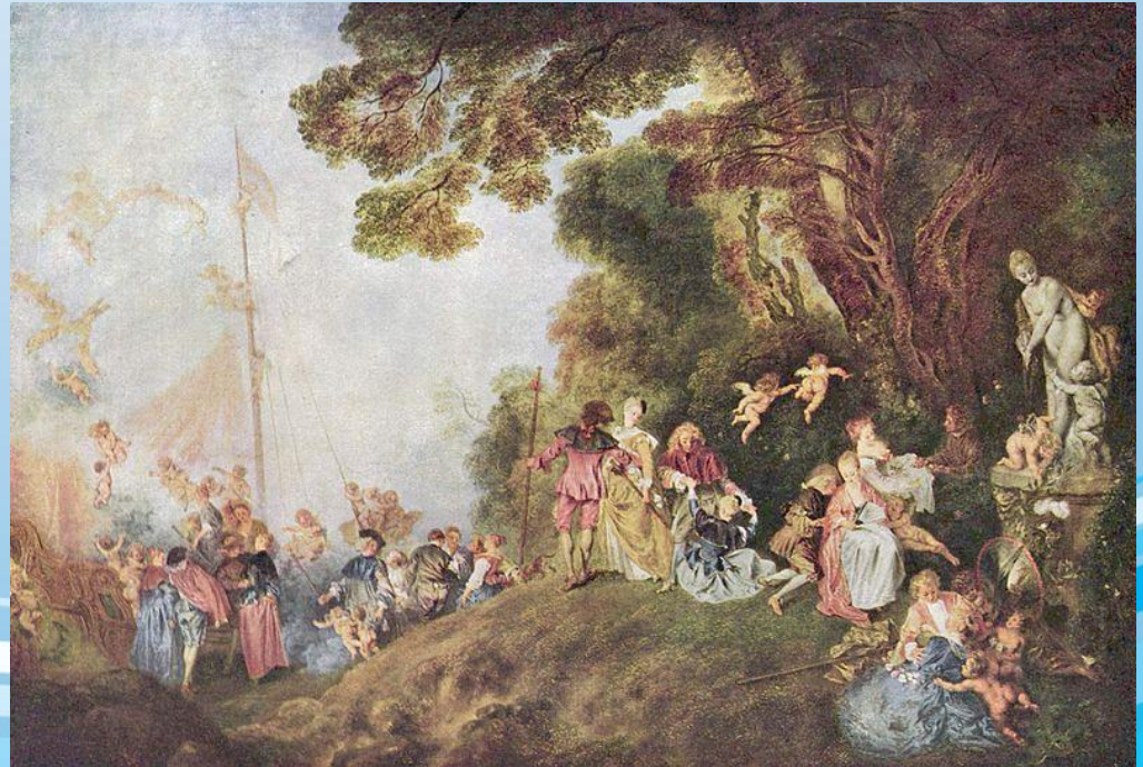
Антуан Ватто «Отплытие на остров Цитеру» (1721)