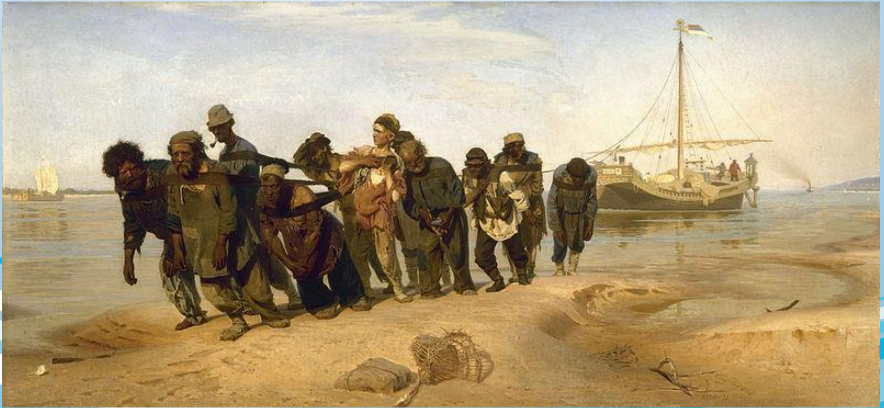
И. Е. Репин. «Бурлаки на Волге» (1873)

Реалистическая живопись получила большое распространение и за пределами Франции. В разных странах она была известна под разными названиями, в России — передвижничество.