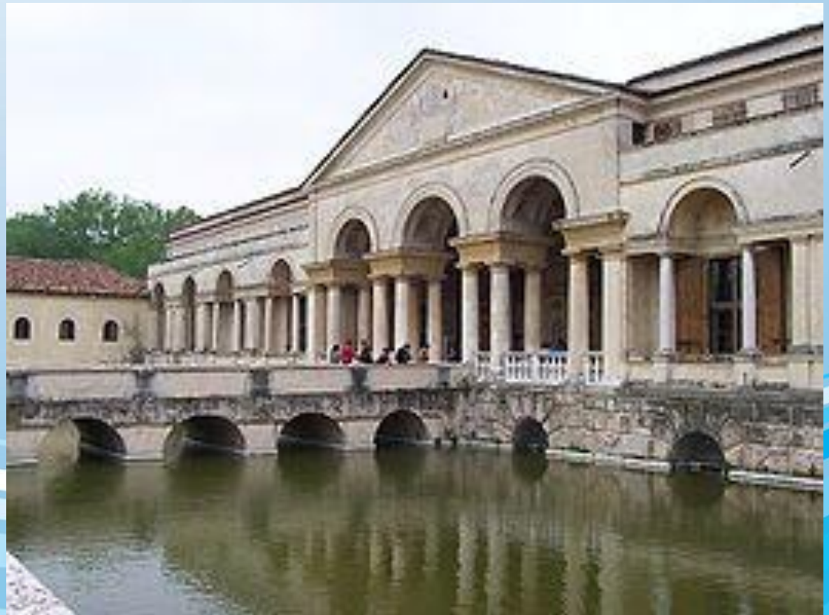
Палаццо дель Те в Мантуе