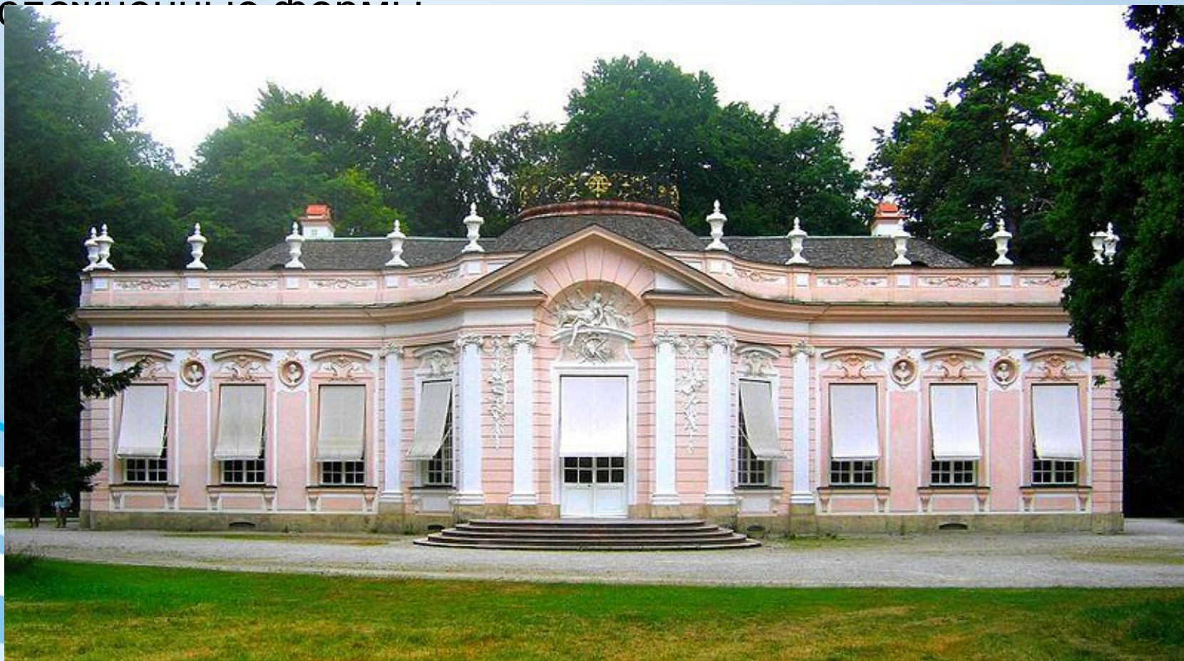
Амалиенбург под Мюнхеном.

Возникшее во Франции, рококо в области архитектуры сказалося главным образом в характере декора, приобретшего подчеркнута изящные, утонченно-устойчивые формы.