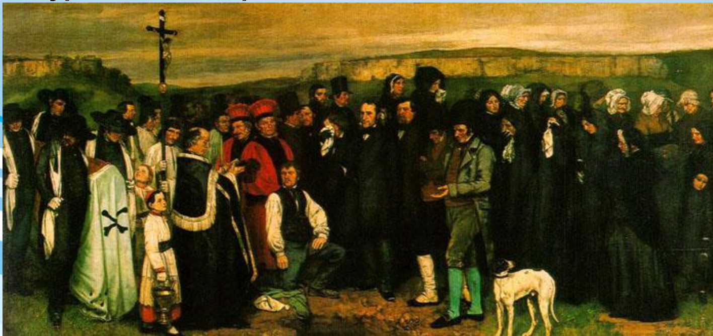
Гюстав Курбе. "Похороны в Орнани". 1849-1850 гг.