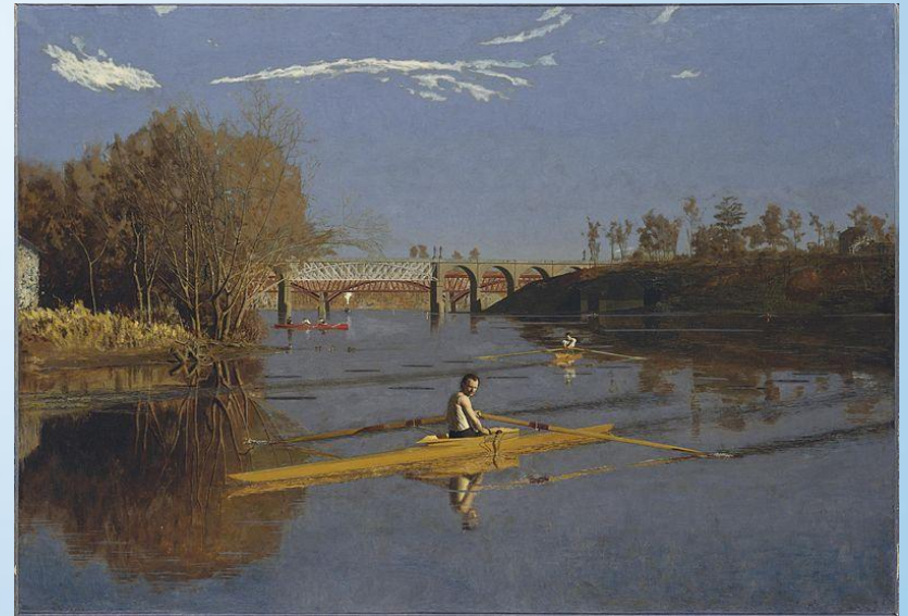
Томас Икинс. «Макс Шмитт в лодке»

Рождение реализма в живописи чаще всего связывают с творчеством французского художника Гюстава Курбе (1819—1877), открывшего в 1855 г. в Париже свою персональную выставку «Павильон реализма». В 1870-е гг. реализм разделился на два основных направления — натурализм и импрессионизм .