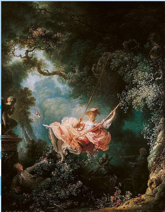
Фрагонар «Качели» (1767)

Образ человека утрачивал самостоятельное значение, фигура превращалась в деталь орнаментального убранства интерьера. Преимущественно декоративный характер имела живопись рококо. Живопись рококо, тесно связанная с интерьером, получила развитие в декоративных и станковых камерных формах.