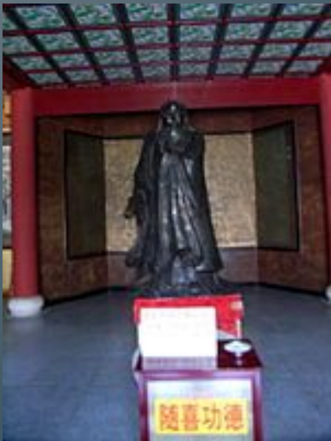
Статуя Лао-цзы в храмовом комплексе Наньюэ Дамяо у горы Хэншань, в храме, посвящённом Лао-цзы, выгравирован весь текст Дао Дэ Цзина