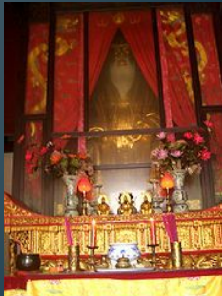
Лао-цзы как божество в китайском храме