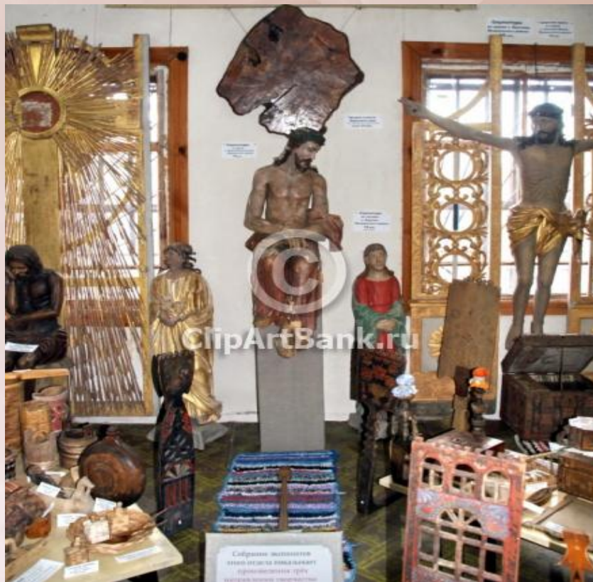
Церковная скульптура начало XVIII века