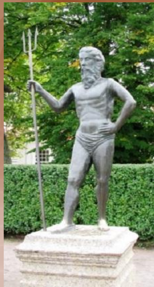
Статуя Нептуна 1715—1716 гг.