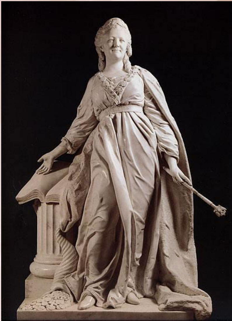
Екатерина II- законодательница 1789-1790 гг