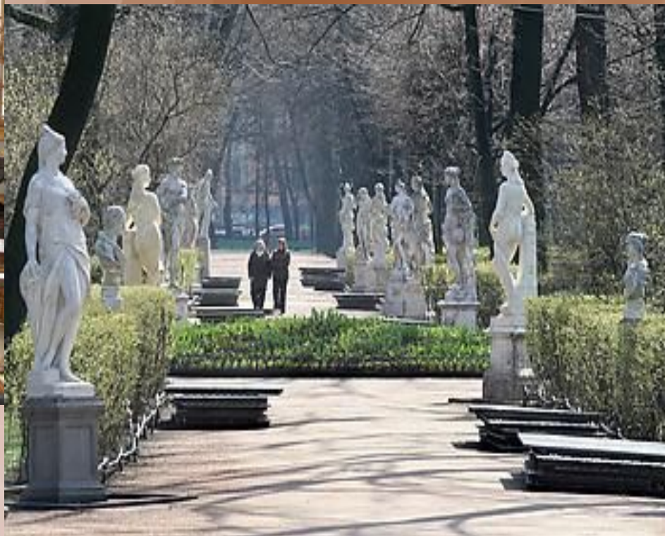
Аллея Летнего сада конец XVIII века