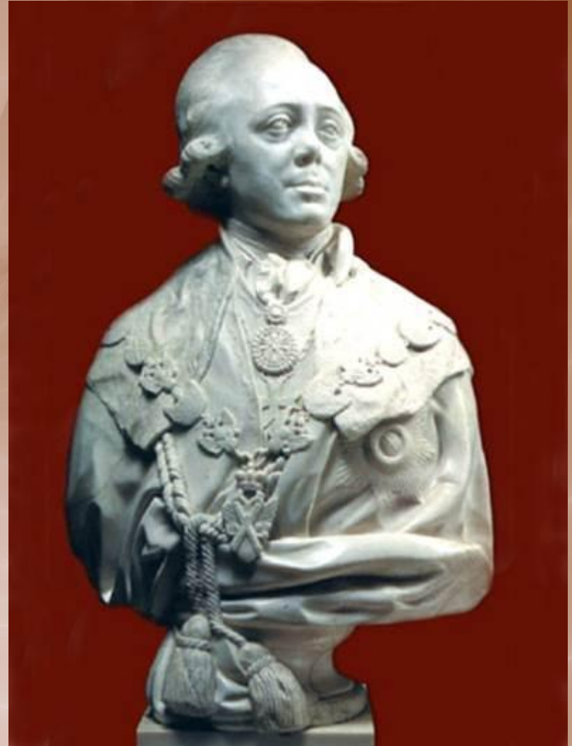
Портрет Павла I 1798 г.