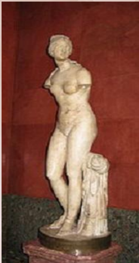
Венера Таврическая 1715—1716 гг.