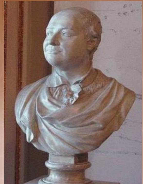
Портрет князя М.В. Ломоносова 1792 г.