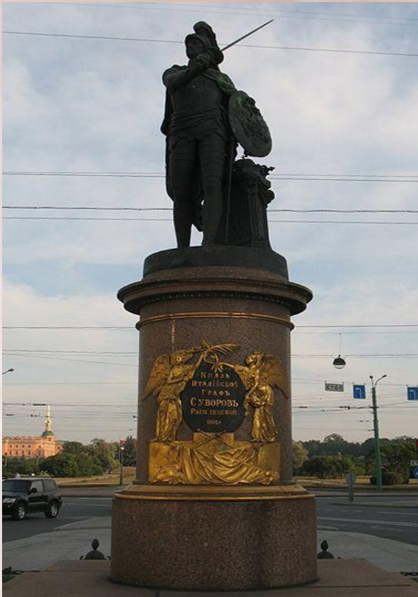
Монумент А.В. Суворову 1799 г.

талантливый русский скульптор-монументалист.