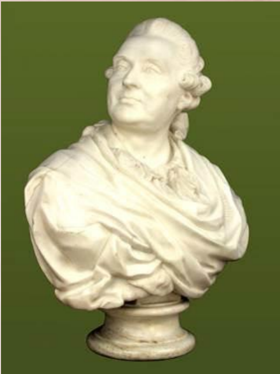
Портрет князя А.М. Голицина 1773 г.

Крупнейший русский скульптор XVIII века, работавший в жанре портрета. Представитель просветительского классицизма в искусстве.