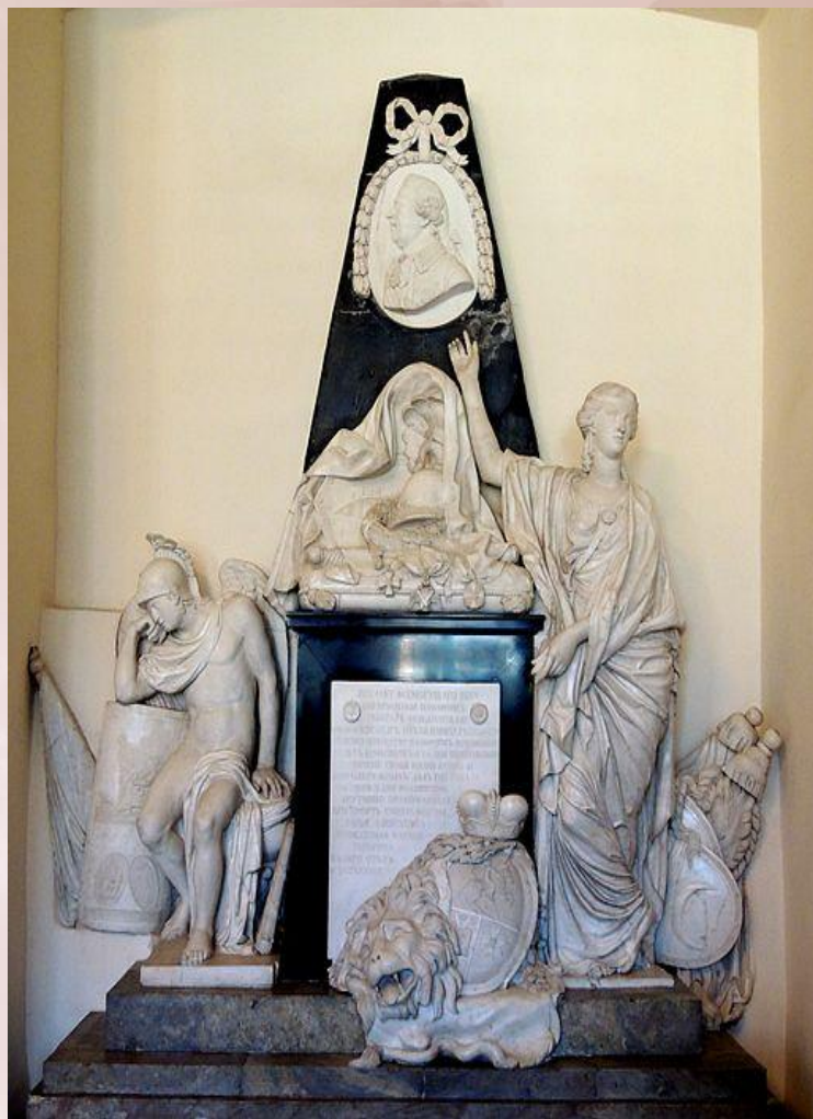
Надгробие Голицина 1744 г.

Русский скульптор, профессор скульптуры, ректор Академии Художеств