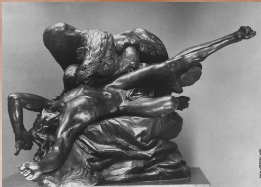
Статуя «Прометей». 1769 г.