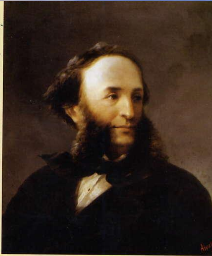
Иван Айвазовский. Автопортрет

Родился 17 июля 1817 года в Феодосии . На протяжении всей своей долгой жизни И.К. Айвазовский был связан с морем, ему он посвятил около 6 тысяч картин.