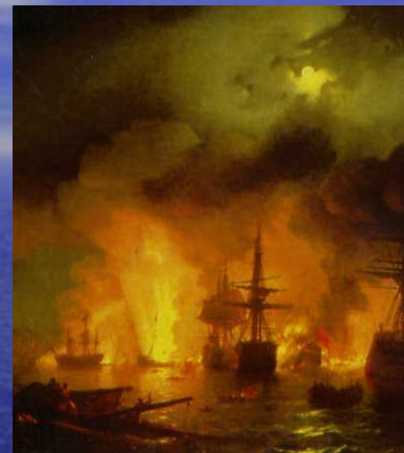
«Сражение при Наварине»

Многие из своих картин художник посвятил подвигам русских моряков. Айвазовский сам участвовал в боевых походах и доказал, что умеет владеть не только кистью, но и оружием. Яркие фрагменты боя изображены на картинах «Сражение при Наварине» и «Чесменский бой»