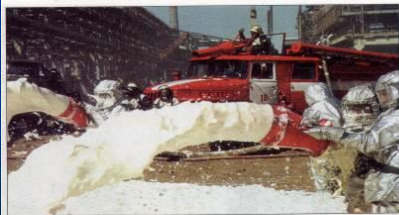
При тушении пожаров на промышленных предприятиях используются современные средства пожаротушения. На снимке: «пенная атака» при ликвидации условного пожара во время проведения международных учений спасателей в Астрахани (август 1994 г.)