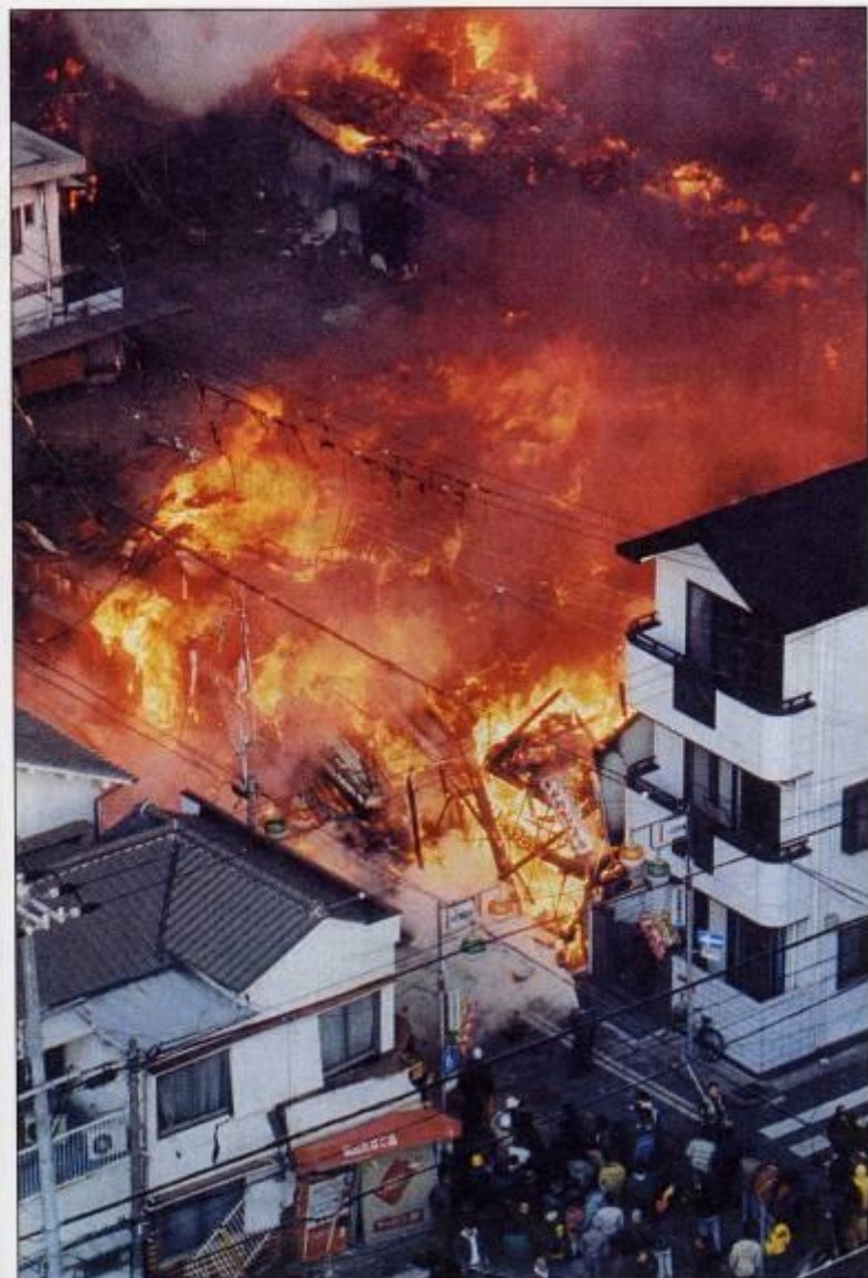
Массовые пожары в городе