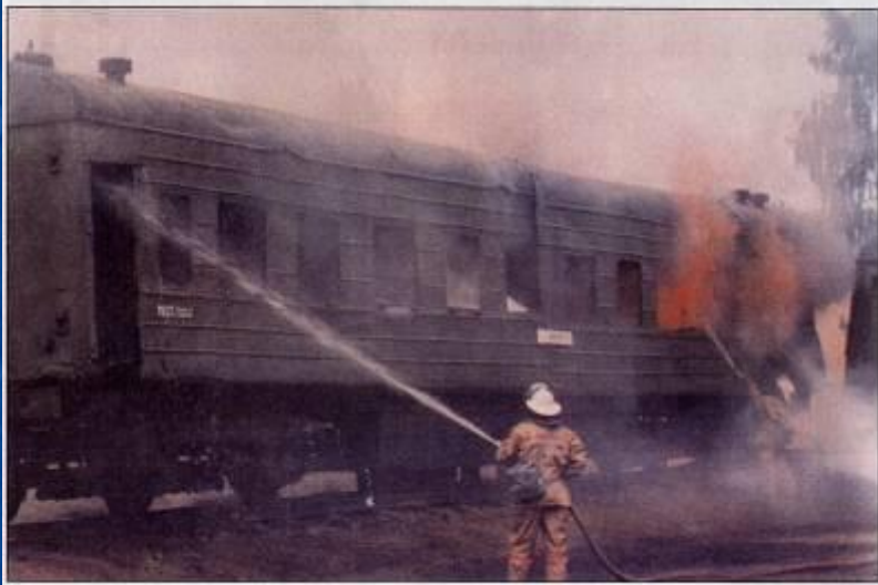
Ликвидация пожара в вагоне пассажирского поезда