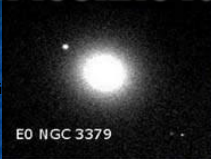
E0 NGC 3379

Эллиптические галактики обозначаются буквой E, имеют разную степень сжатия: от круглых (E0) до сильно сжатых (E7). Заметное вращение наблюдается только у галактик со значительным сжатием.