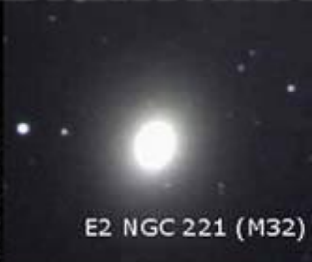
E2 NGC 221 (M32)