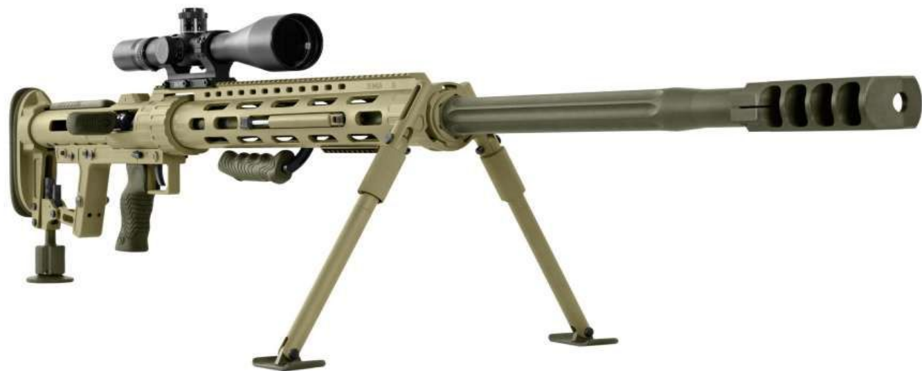
12,7 мм снайперська гвинтівка Snipex M100