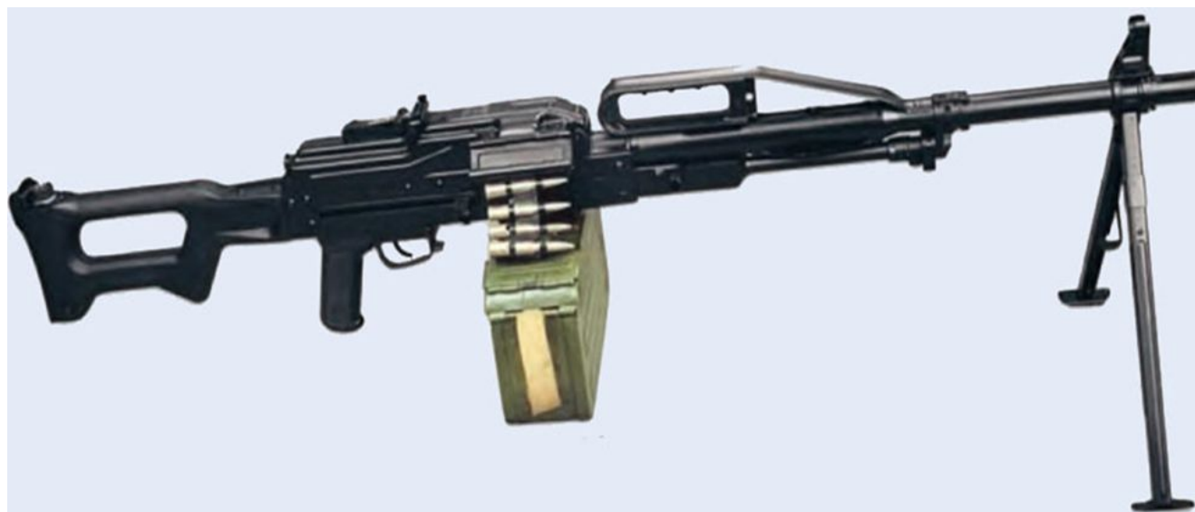
7,62-мм кулемет ККМ