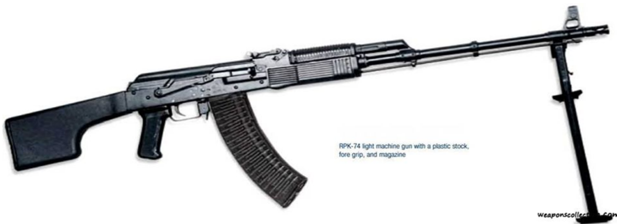
RPK-74 light machine gun with a plastic stock, fore grip, and magazine