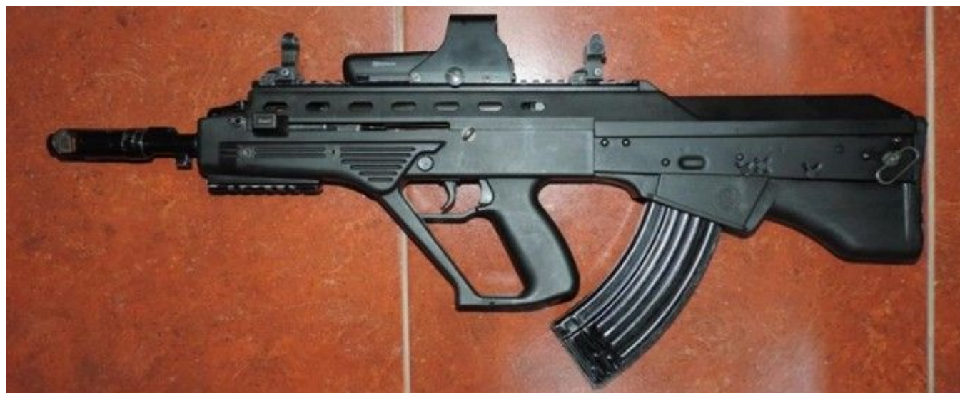
5,45-мм автомат Вулкан-М (Малюк)