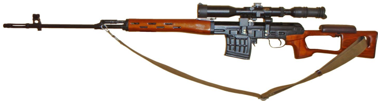
7, 62 мм снайперська гвинтівка Драгунова (СВД)

автомат, кулемет, гранатомет, снайперську гвинтівку