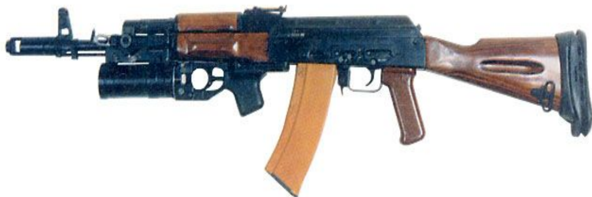
5,45-мм автомат АК 74 з 40 мм підствольним гранатометом ГП 25