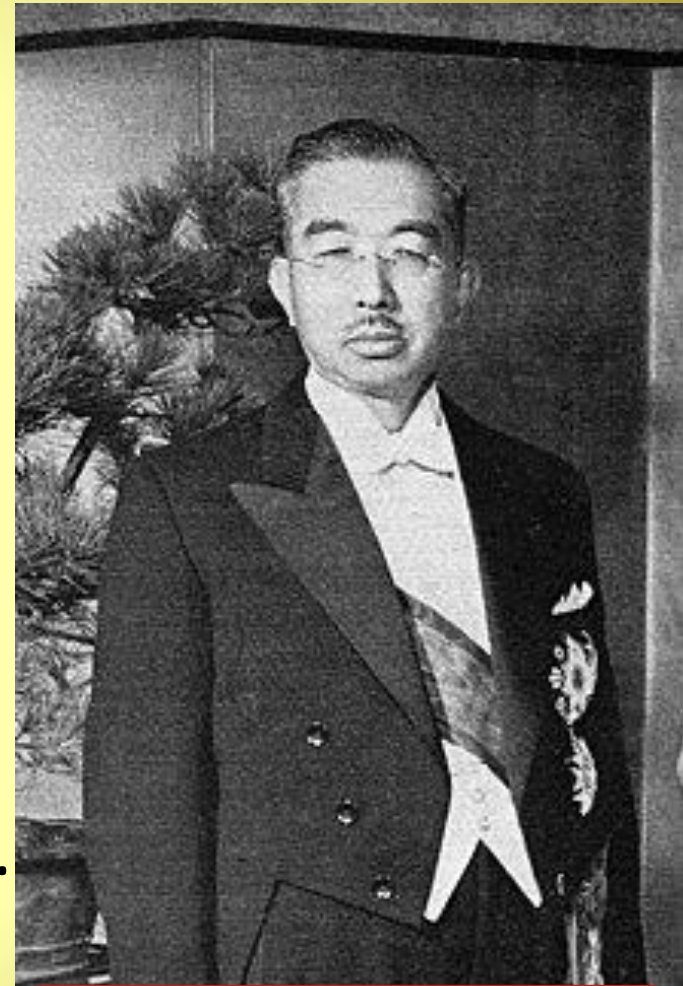
Хирохито (1926- 1989 гг.) – император Японии.