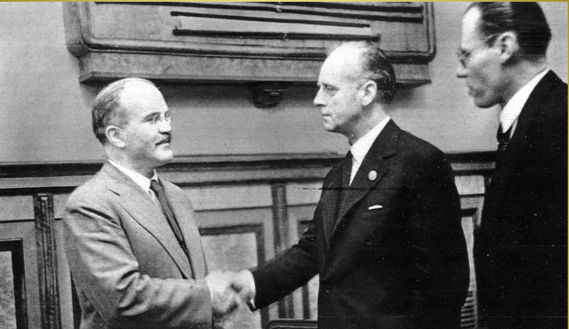
Вячеслав Михайлович Молотов (1890- 1986 гг.) – советский политический деятель, министр иностраннных дел СССР в 1939- 1956 гг.