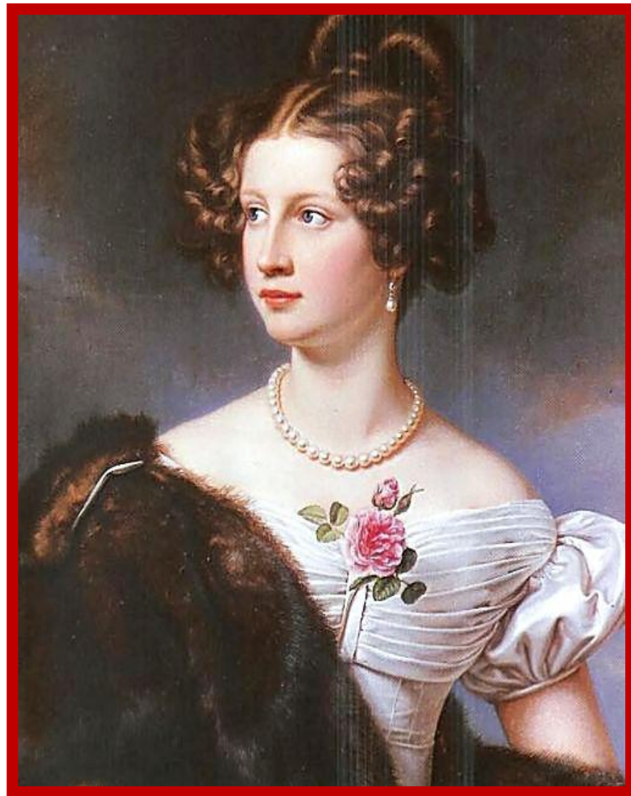
Шарлотта Александра Федоровна