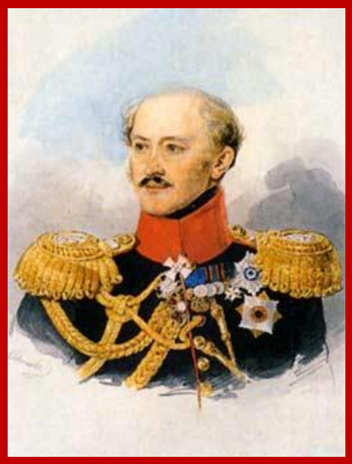
А.Х.Бенкендорф 1783 - 1844