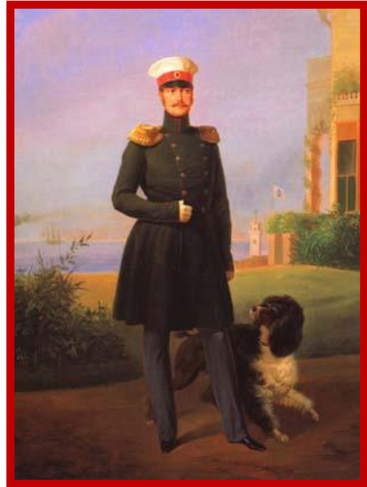
Николай «Палкин» (1796 – 1855)