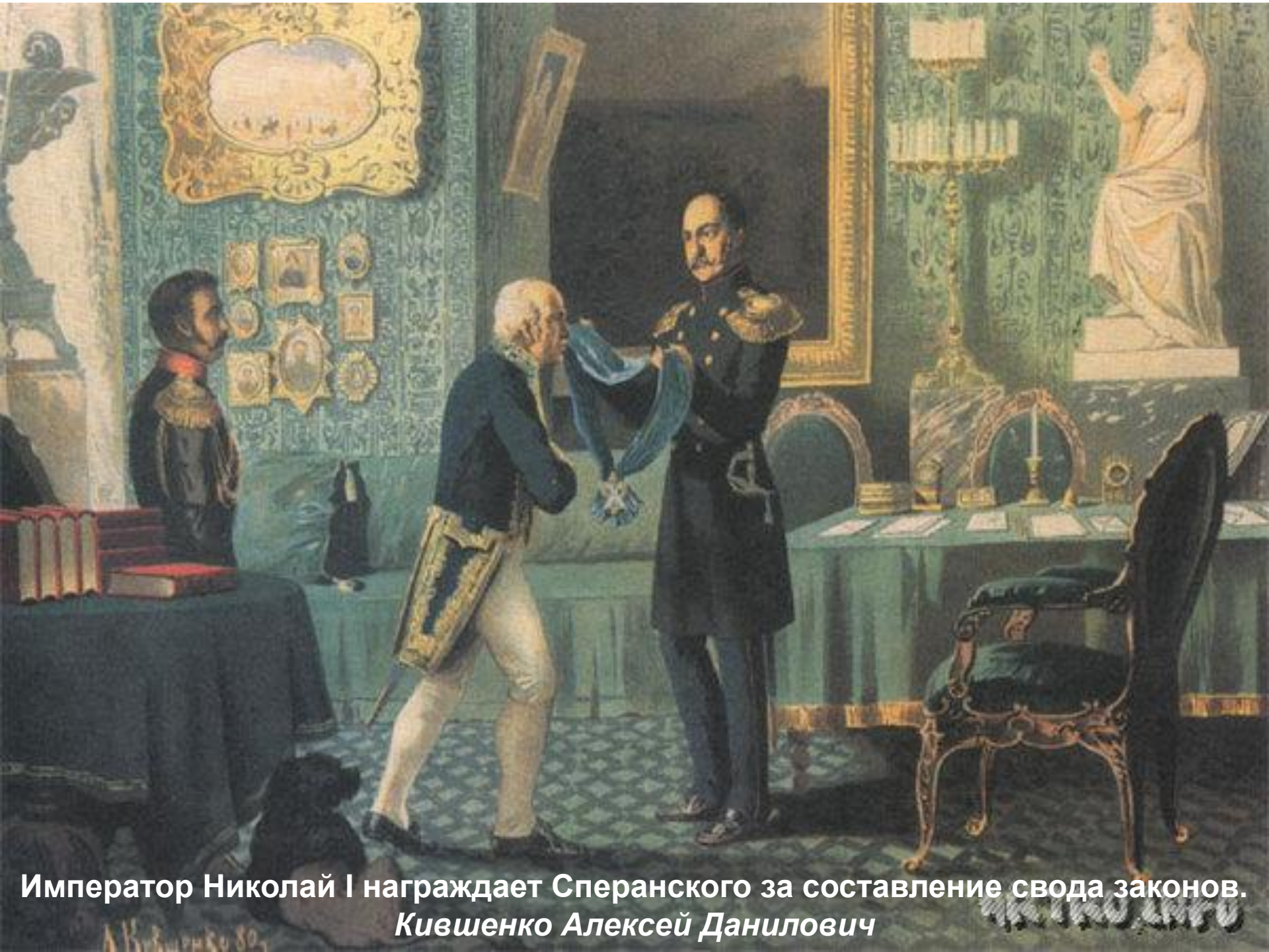
Император Николай I награждает Сперанского за составление свода законов. Кившенко Алексей Данилович