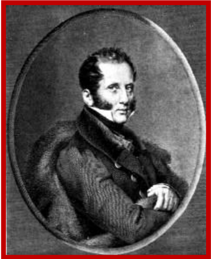
С.С. Уваров 1786 - 1855