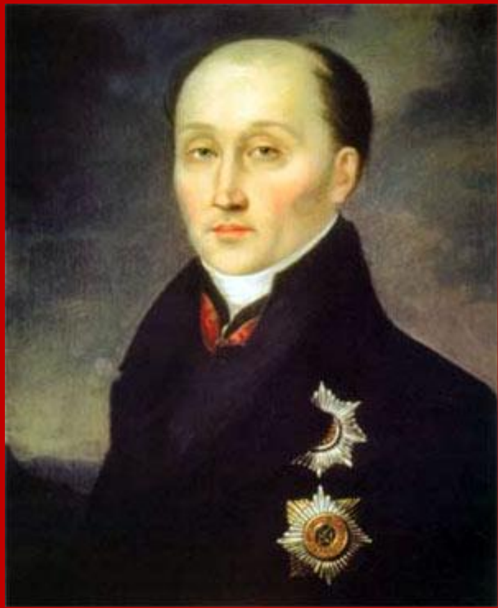
М.М.Сперанский 1772 - 1839