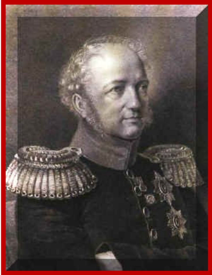
Е.Ф.Канкрин 1774 - 1845