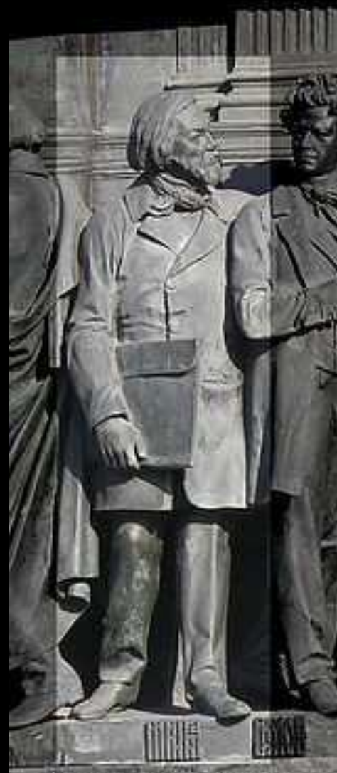
М. И. Глинка на Памятнике «1000-летие России» в Великом Новгороде

В 1802 г. в России создается Филармоническое общество. В его залах выступали с концертами знаменитые музыканты, среди которых Ф. Лист, Г. Берлиоз, П. Виардо. В сезон общество давало несколько больших концертов, знакомило публику с новинками, именно здесь впервые в России прозвучали произведения Генделя, Гайдна, Моцарта, Бетховена. Основателем русской школы в музыке стал М.И. Глинка. «Жизнь за царя», «Руслан и Людмила» положили начало двум направлениям русского оперного искусства — народной музыкальной драме и опере-сказке.