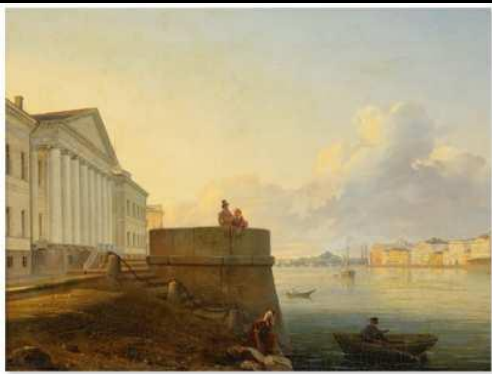
Академия наук . Первая половина XIX века

Число грамотных людей в первой половине XIX века в Российской империи было ничтожным. Развитие книжного дела замедлялось и тем, что читающая часть общества предпочитала книги на иностранных языках, прежде всего на французском. В 1801 году Александр I, взойдя на престол, отменил запрет на ввоз иностранных книг, а в 1802 году — предварительную цензуру и дал разрешение на открытие частных типографий. Крупнейшими книгоиздателями являлись Академия наук и Московский университет. Университетские воспитанники, профессора и «любители наук» нередко завещали свои библиотеки университету. Так в университетской библиотеке появились богатые книжные собрания М.Н. Муравьева Т.Н. Грановского, собрание гравюр Ф.Ф. Вигеля.