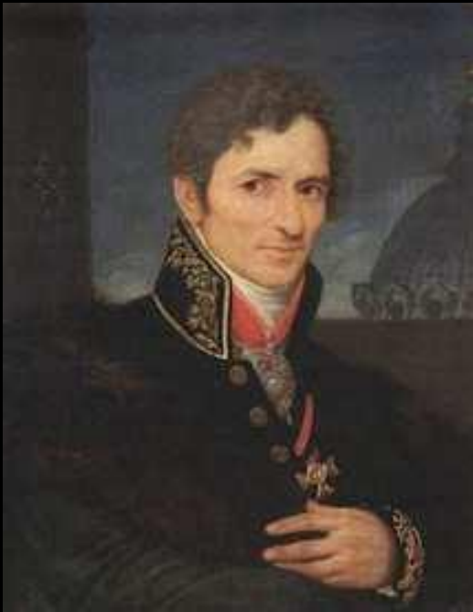
Автор проекта А. Н. Воронихин

Непростую задачу должен был решить архитектор, которому, по замыслу Павла I, предстояло возвести новый храм — Казанский собор . Император желал, чтобы этот храм напоминал собор святого Петра в Риме, величайший собор католического мира. Спустя годы Казанский собор стал мемориалом Отечественной войны 1812-го года. Его иконостас был отделан серебром, которое казаки отбили у французов, пытавшихся увезти сокровища из России, здесь же поместили военные трофеи — знамена и штандарты, ключи от крепостей. В пределах собора похоронили М.И. Кутузова.