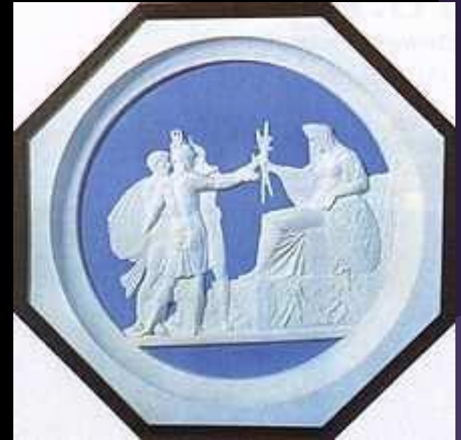
Ф. П. Толстой. Народное ополчение 1812 года. 1816. Медальон. Воск