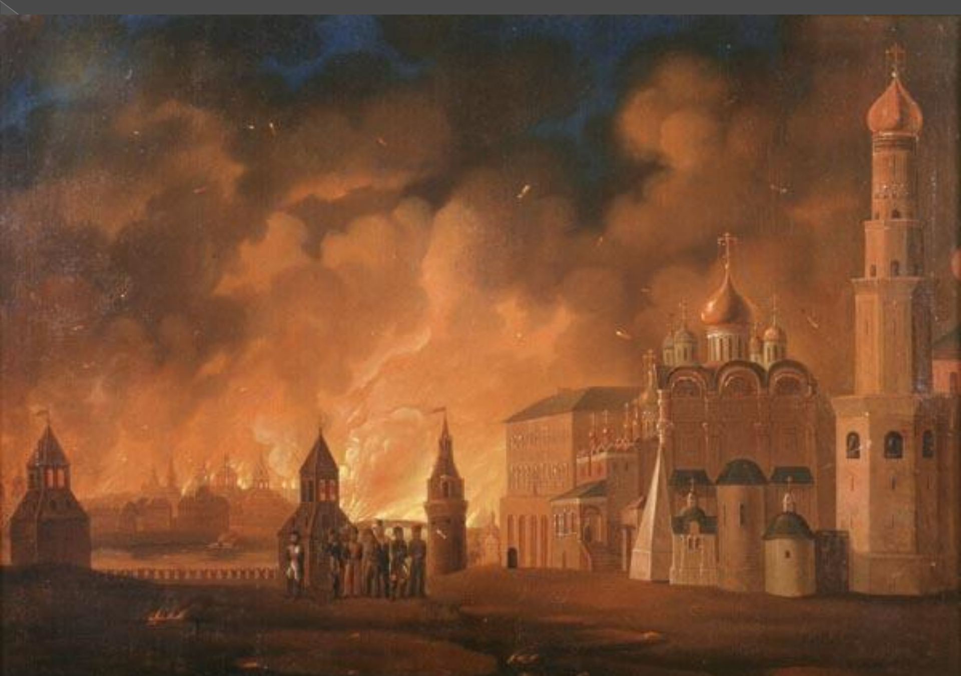
Пожар Москвы. А. Ф. Смирнов (1813)