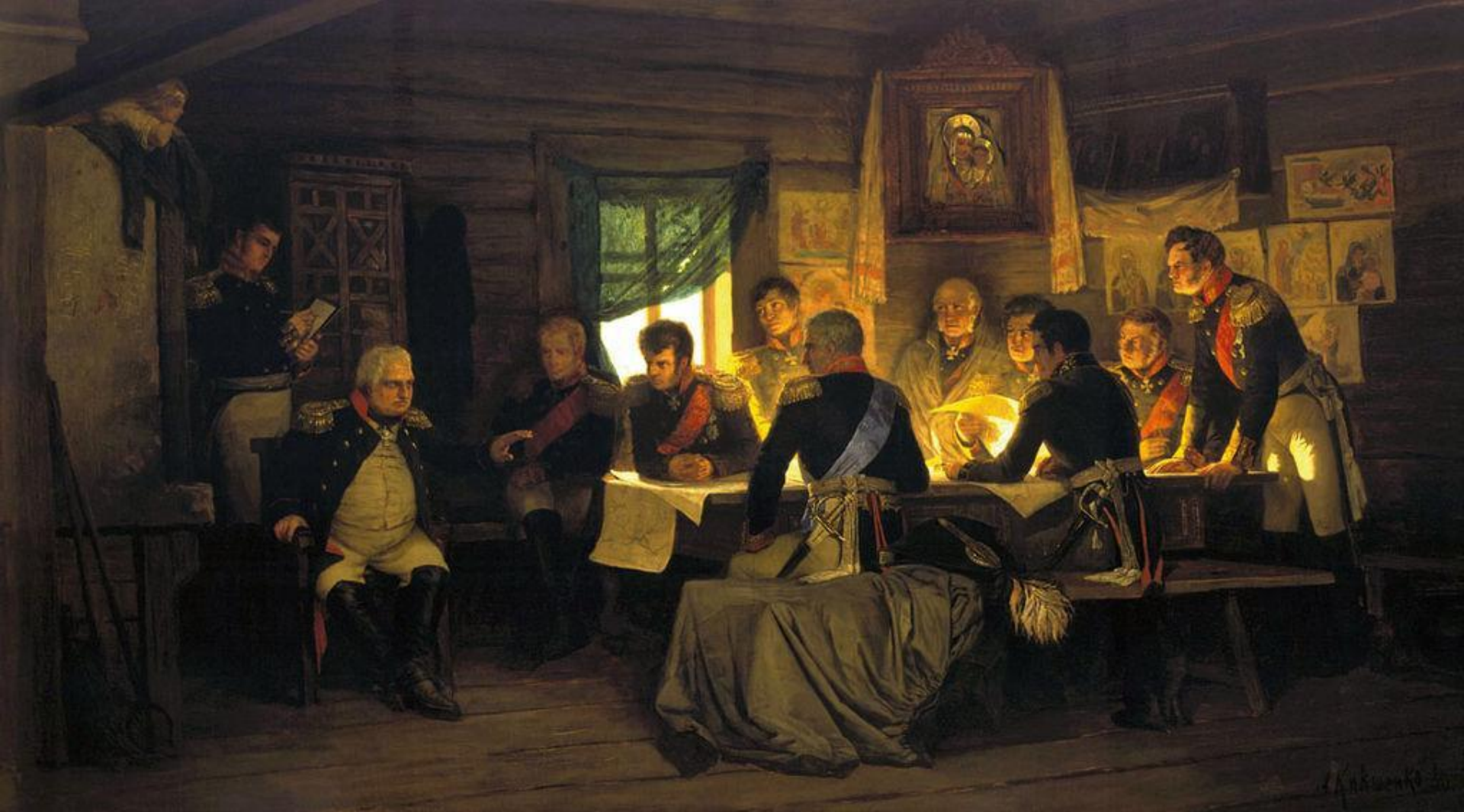
Военный совет в Филях, 1(13) сентября 1812 г.