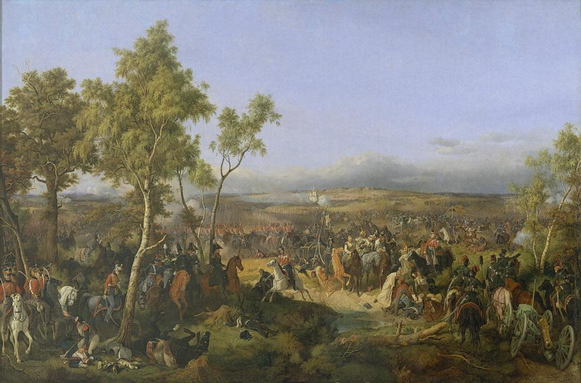
Сражение при Тарутино 6 (18) октября 1812 года. Гесс (1847 год)