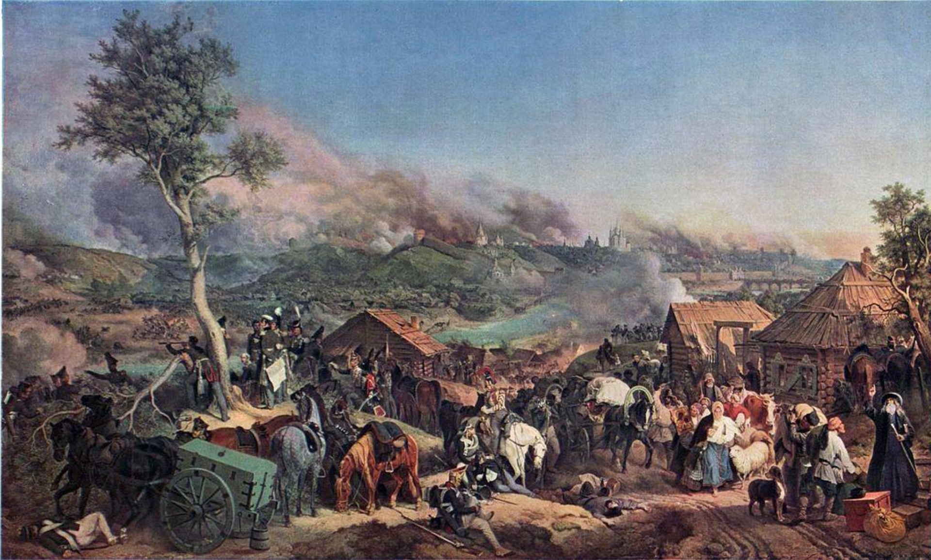
Сражение при Смоленске 5 (17) августа 1812 года. Гесс (1846 год)