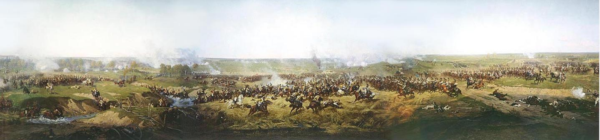
Атака русских кирасир под Бородино. Фрагмент панорамы Бородинского сражения . Рубо(1912)