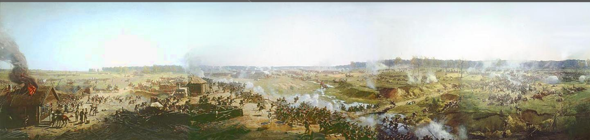
Гвардейские полки отражают атаки французской кавалерии. Фрагмент панорамы Бородинского сражения. Рубо(1912)