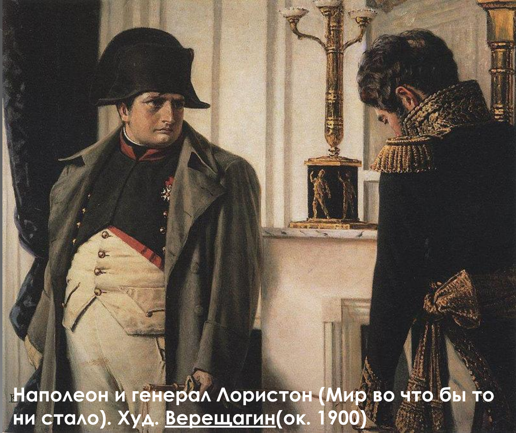
Наполеон и генерал Лористон (Мир во что бы то ни стало). Худ. Верещагин (ок. 1900)