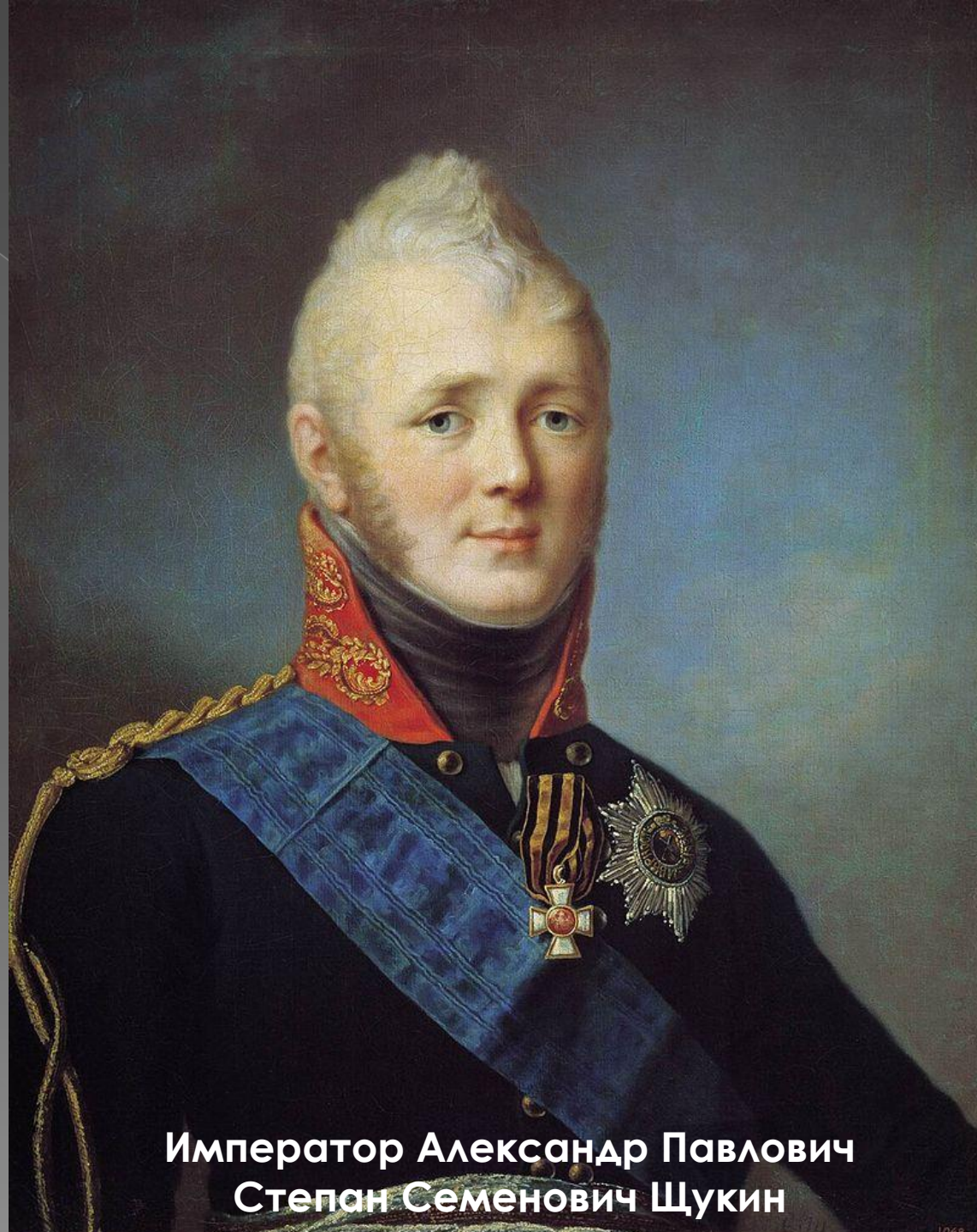
Император Александр Павлович Степан Семенович Жукин