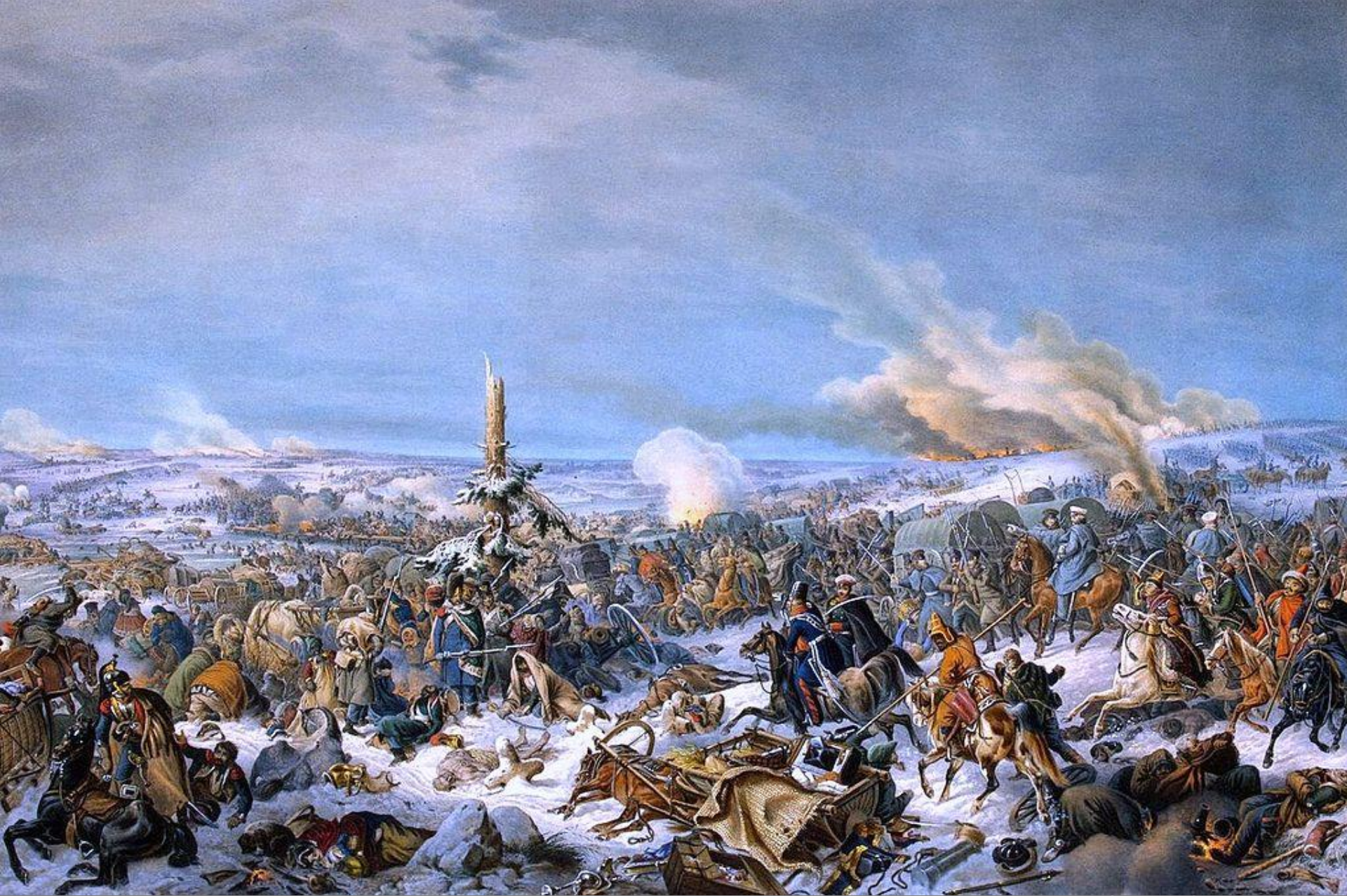
Отступление французов через Березину 17 (29) ноября 1812 года. Гесс (1844)