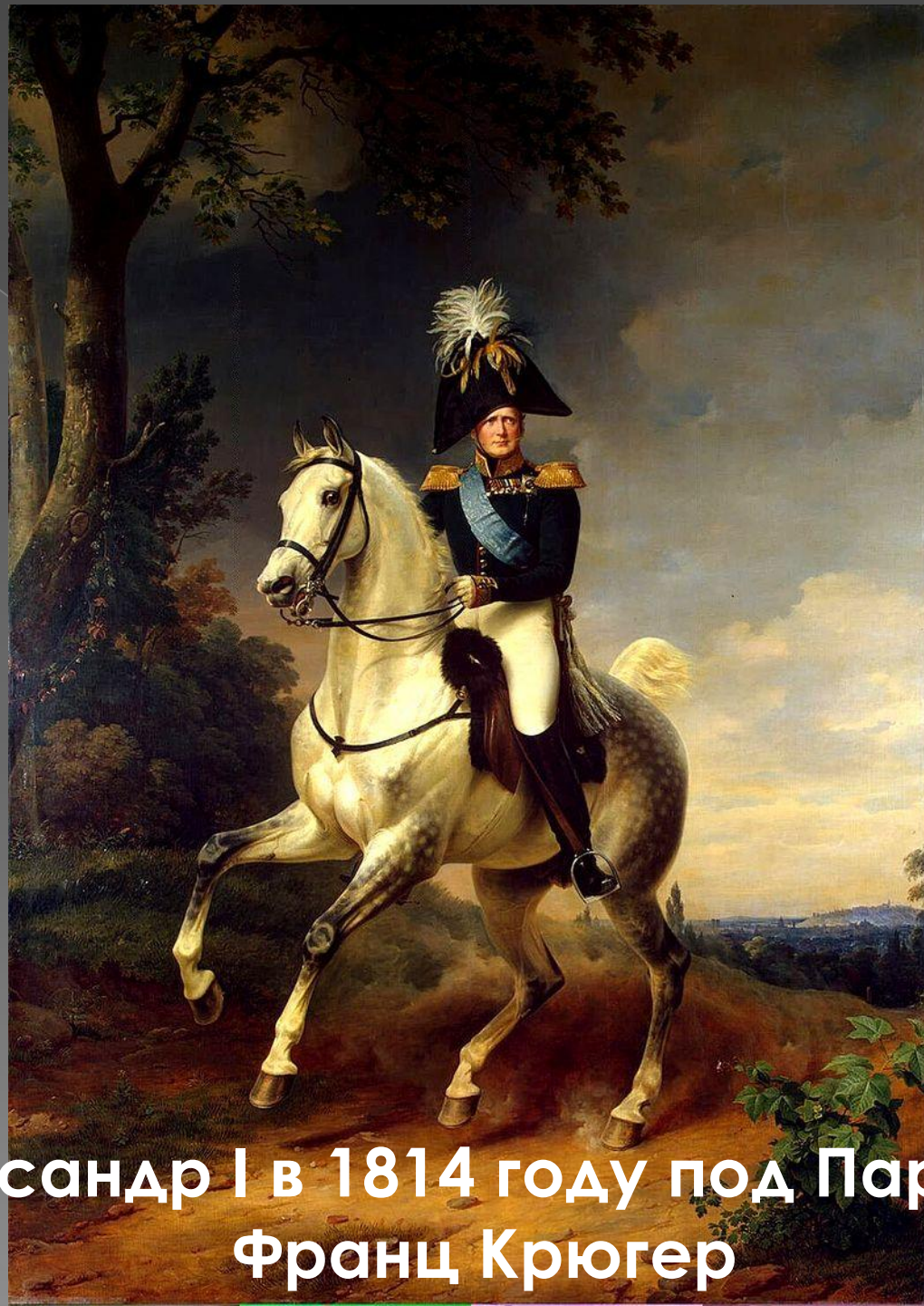
Александр I в 1814 году под Парижем Франц Крюгер