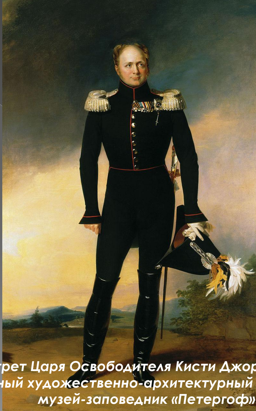
Портрет Царя Освободителя Кисти Джорджа Доу/ Государственный художественно-архитектурный дворцово-парковый музей-заповедник «Петергоф»