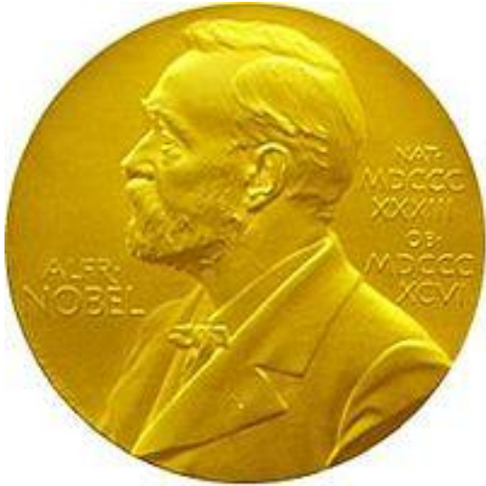
Медаль, вручаемая лауреату Нобелевской премии

В 1903 году 54-летний Павлов сделал доклад на XIV Международном Медицинском Конгрессе в Мадриде. И в следующем, 1904 году, Нобелевская премия за исследование функций главных пищеварительных желез была вручена И. П. Павлову, — он стал первым российским Нобелевским лауреатом