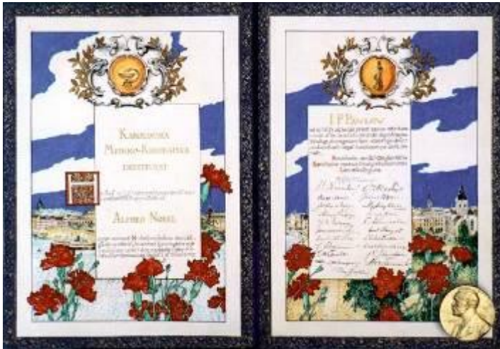
Диплом и золотая медаль лауреата Нобелевской премии 1904 года

В 1903 году 54-летний Павлов сделал доклад на XIV Международном Медицинском Конгрессе в Мадриде. И в следующем, 1904 году, Нобелевская премия за исследование функций главных пищеварительных желез была вручена И. П. Павлову, — он стал первым российским Нобелевским лауреатом