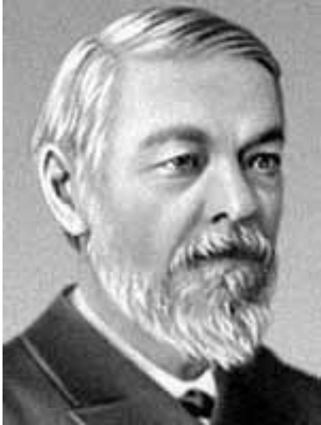
И. М. Сеченов