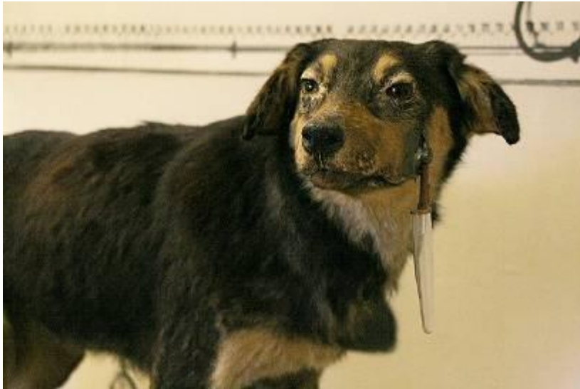
Собака Павлова, Музей Павлова, 2005

В Мадридском докладе, сделанном на русском языке, И. П. Павлов впервые сформулировал принципы физиологии высшей нервной деятельности, которой он и посвятил последующие 35 лет своей жизни. Такие понятия как подкрепление, безусловный и условный рефлекс, стали основными понятиями науки о поведении