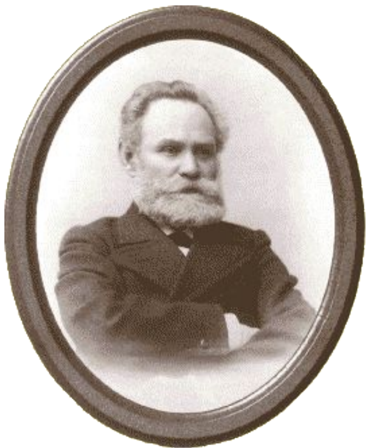
Иван Петрович ПАВЛОВ