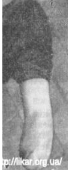
Глухая гипсовая повязка после ампутации.