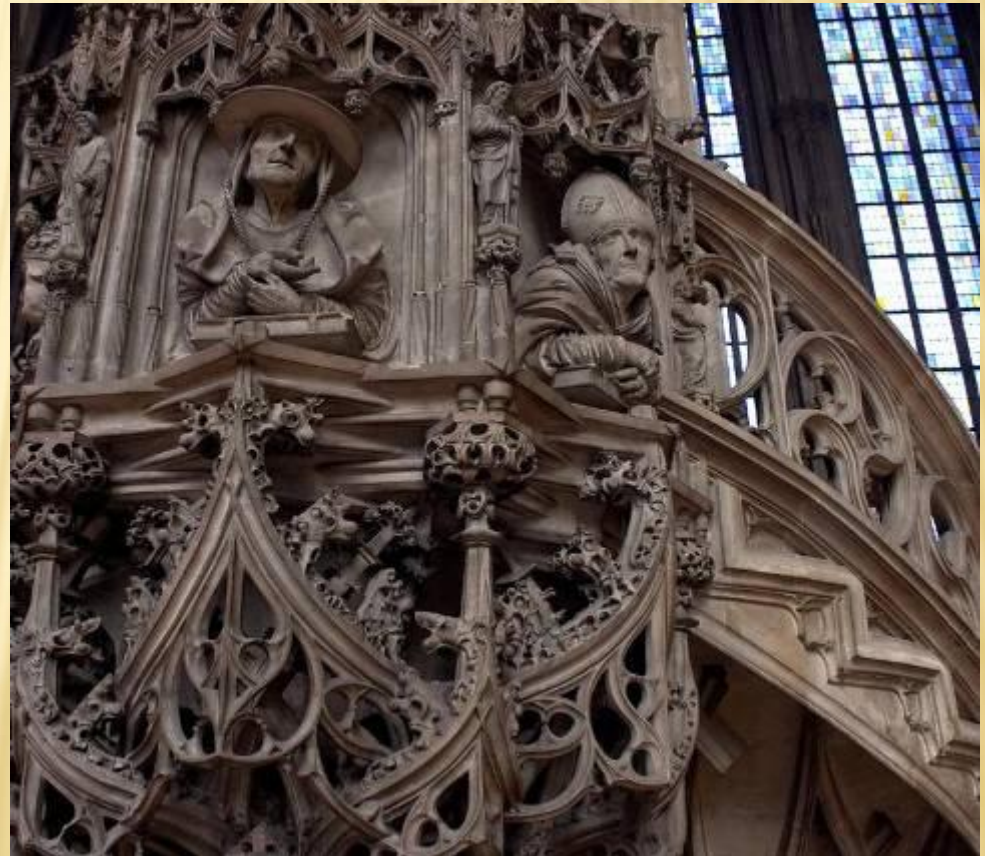
Резьба по камню XVI века

а. Резьба по камню - процесс придания камню требуемой формы и внеш. отделки при помощи распиловки, токарной обработки, сверления, шлифовки, полировки, гравировки (резцом, ультразвуком).