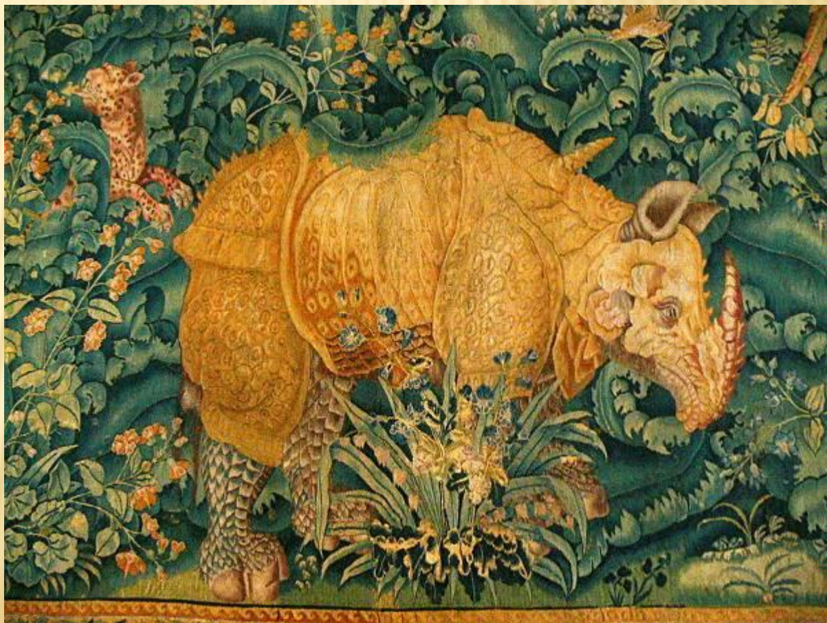
Носорог. Фландрия. 1550. Замок Кронборг

2. Гобелён (фр. gobelin ), или шпалера , — один из видов декоративно-прикладного искусства, стенной односторонний безворсовый ковёр с сюжетной или орнаментальной композицией, вытканый вручную перекрёстным переплетением нитей.