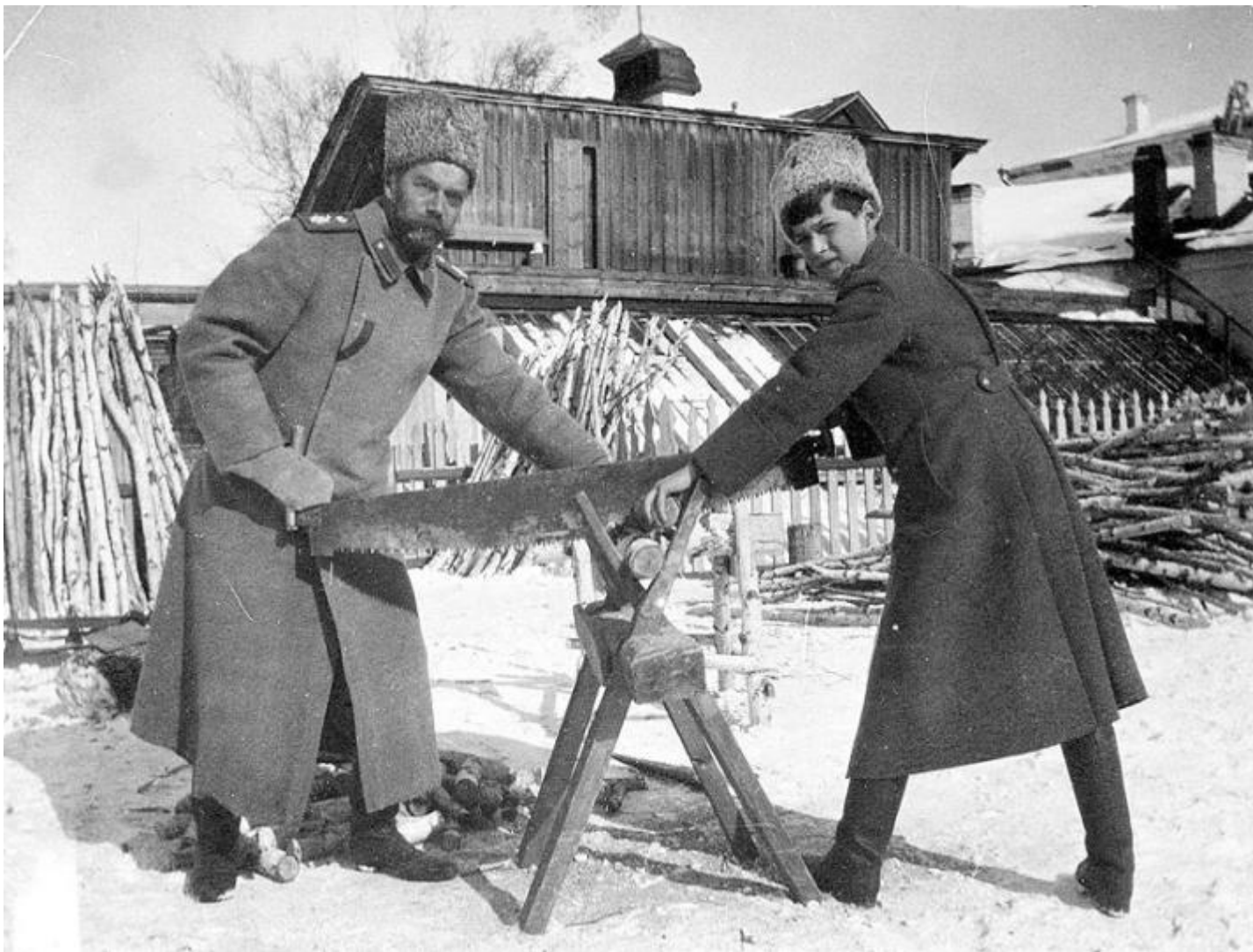
Ссылка отрекшегося Николая II в Тобольске