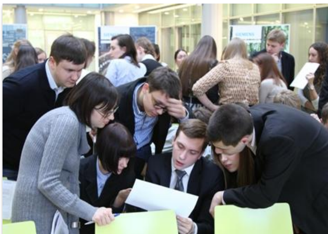
Restricted © Siemens AG 2015 All rights reserved.