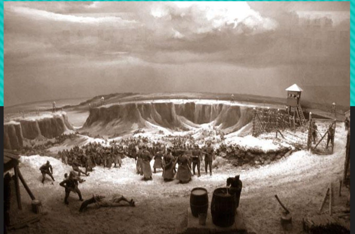
Табір смерті “Хорольська яма”