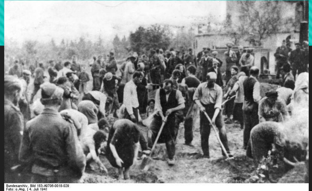
14. Juli 1941

Українські євреї примушені копати власні могили, липень 1941р.