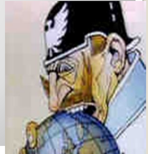
Карикатура на світові зазіхання Вільгельма II