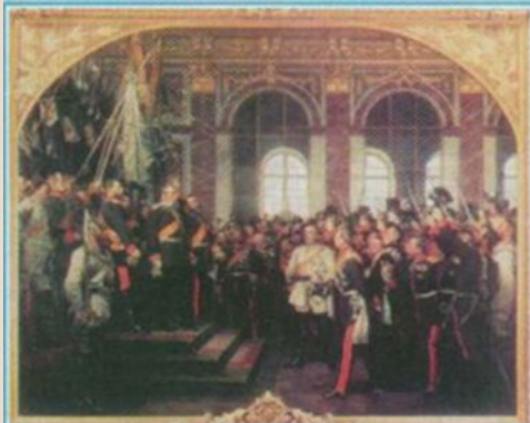
Проголошення Німецької імперії (Версаль, 1871 р.)