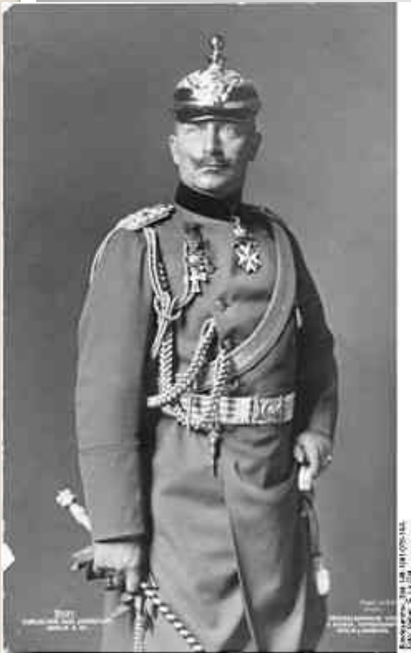
Вільгельм II Гогенцоллерн