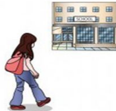
go to school