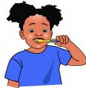
brush your teeth