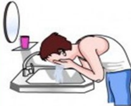
wash your face