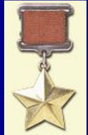
Медаль "Золотая Звезда"

8 мая 1965 года Президиум Верховного Совета СССР издал Указ об утверждении Положения о почетном звании, в этот же день с вручением ордена Ленина и медали «Золотая Звезда» оно было присвоено городу Волгограду.