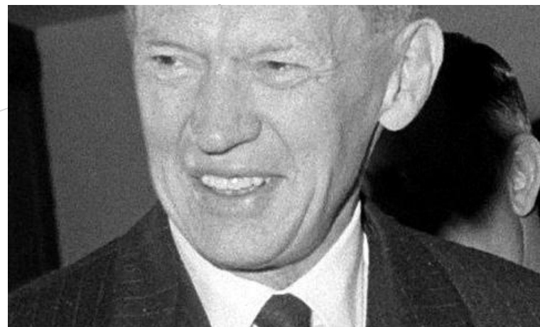
Морис Кув де Мюрвиль