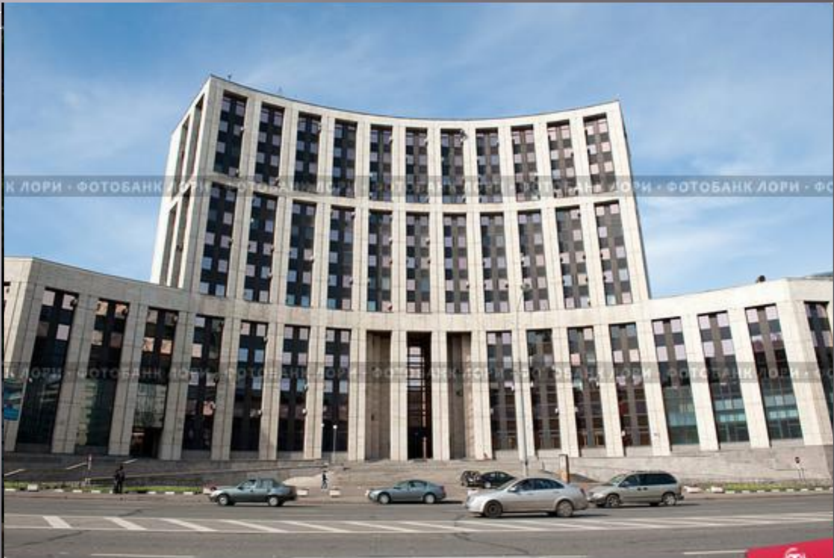
Проспект Академика Сахарова. Москва