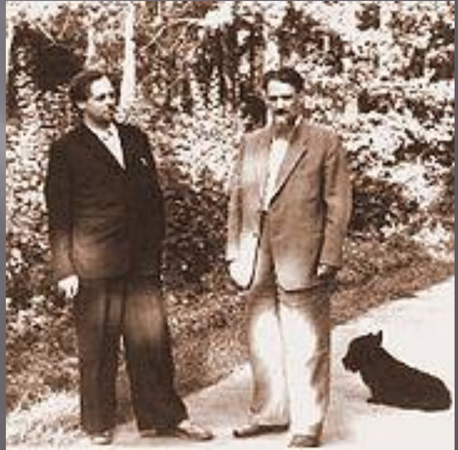
Сахаров и Курчатов (изучали атомную бомбу)

В 1948 году был зачислен в специальную группу и до 1968 года работал в области разработки термоядерного оружия, участвовал в проектировании и разработке первой советской водородной бомбы по схеме, названной «слойка Сахарова». Также Сахаров в 1950-51 гг. проводил работы по управляемой термоядерной реакции.