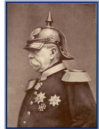
Отто фон Бисмарк

-запретил предоставление России кредитов, -повысил пошлины на ввоз российских товаров в Германию