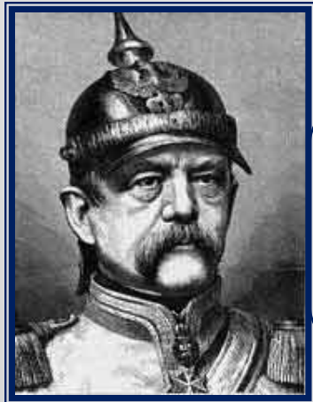
Отто фон Бисмарк

Германия считала Россию единственной консервативной силой в Европе, которая может остановить растущее демократическое движение в Европе.