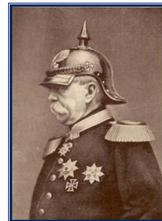
Отто фон Бисмарк

-запретил предоставление России кредитов, -повысил пошлины на ввоз российских товаров в Германию