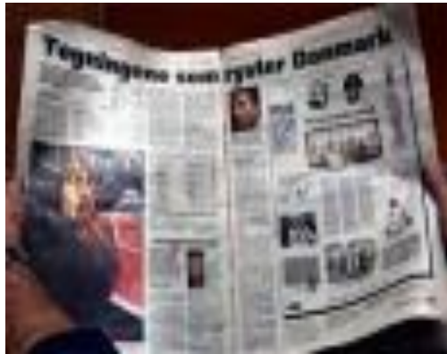
Средства массовой информации