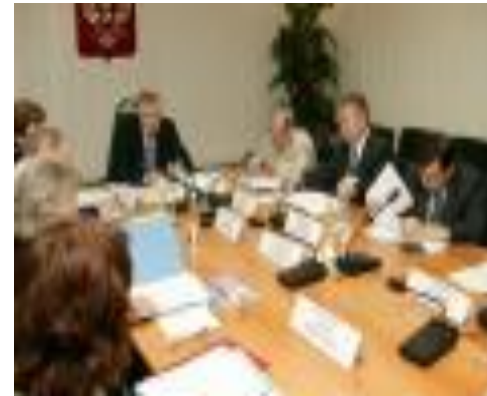
Официальная сфера, законодательство