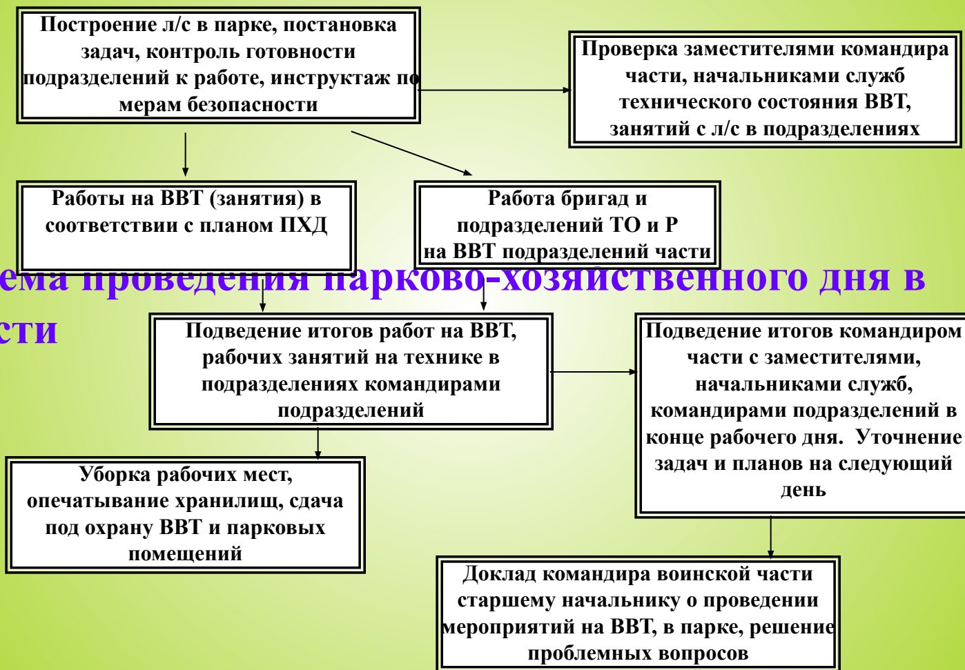
Схема проведения парково-хозяйственного дня в части