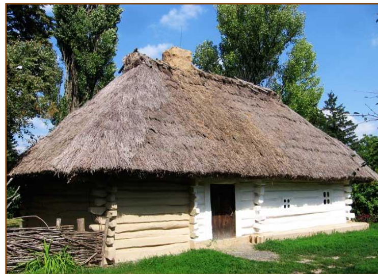
Хата Шевченків, с. Моринці