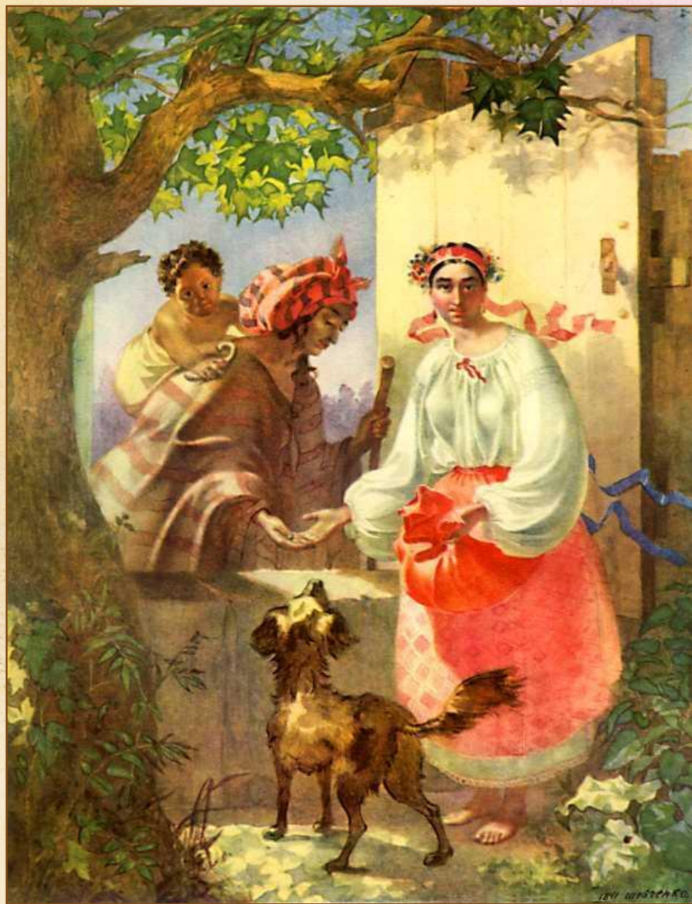
«Циганка-ворожка». 1841 р.