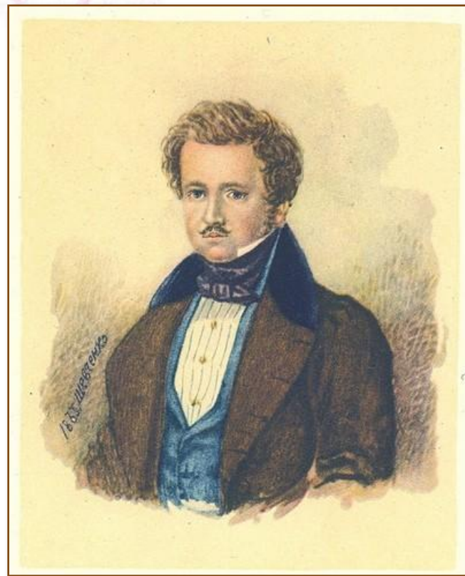
Т. Шевченко. Портрет пана Енгельгардта (акварель). 1833 р.

Тарас Шевченко був кріпаком у пана Павла Енгельгардта, який помітив здібності хлопчика до малювання й віддав його вчитися, щоб зробити своїм домашнім живописцем.