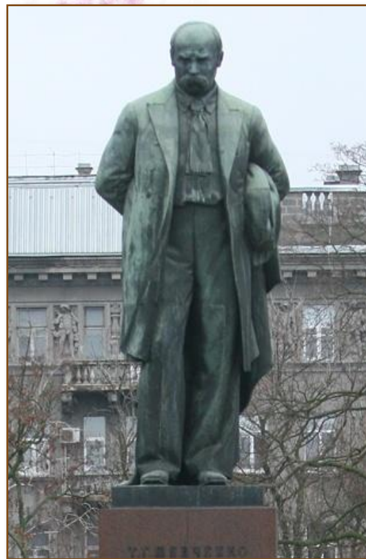
Пам'ятники Т. Г. Шевченкові в Харкові та Києві