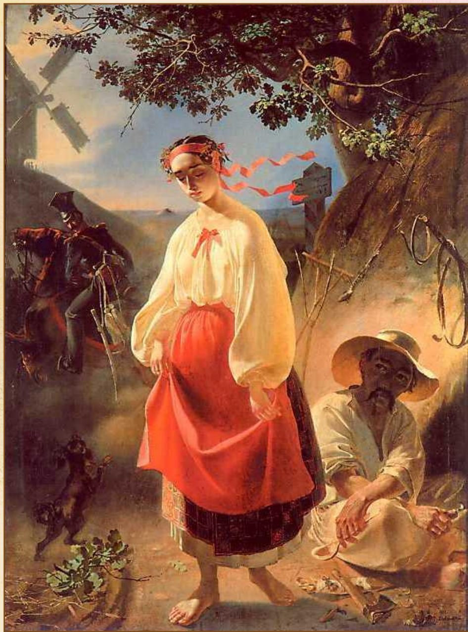
«Катерина». 1842 р.