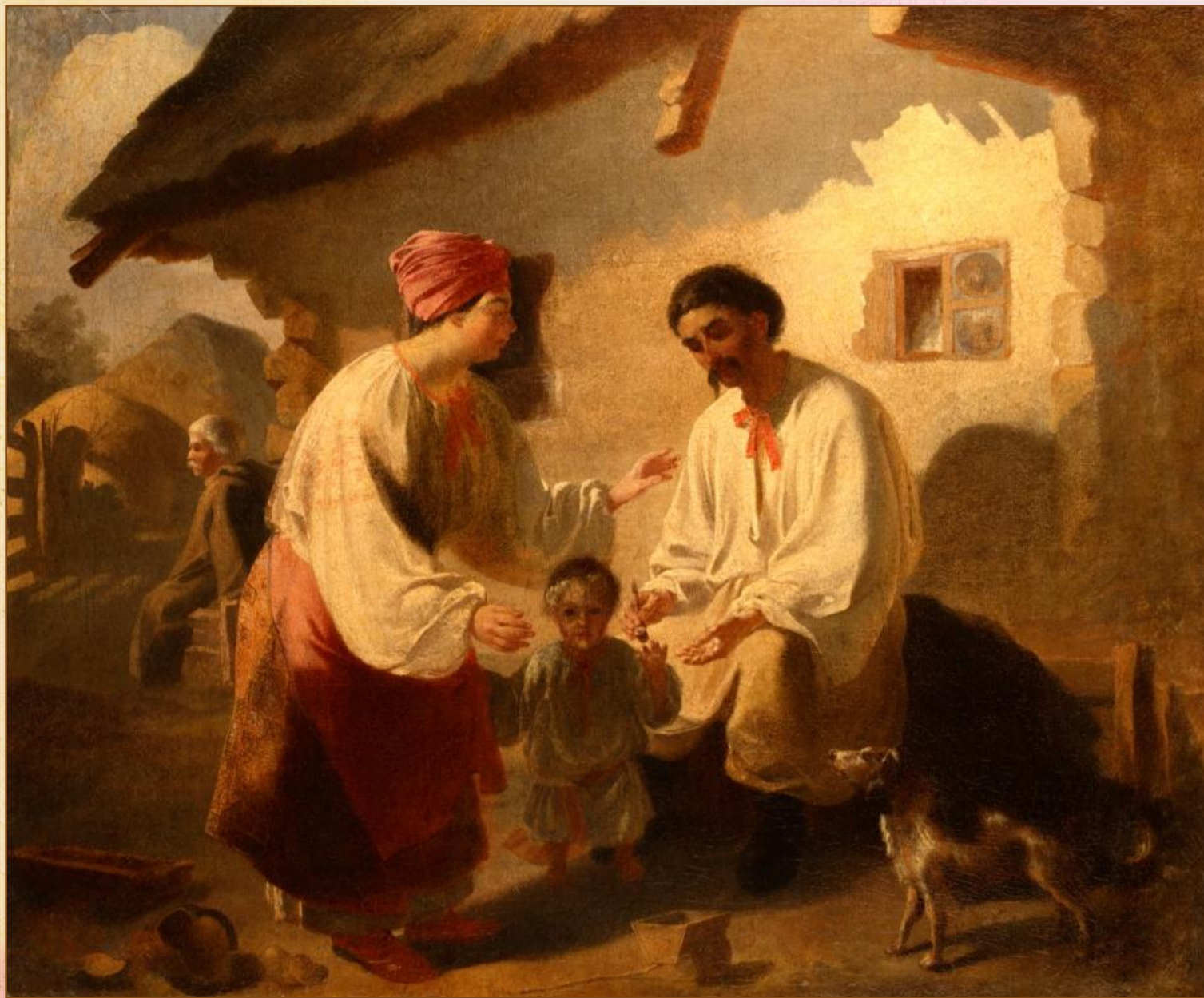
«Сільська родина». 1843 р.