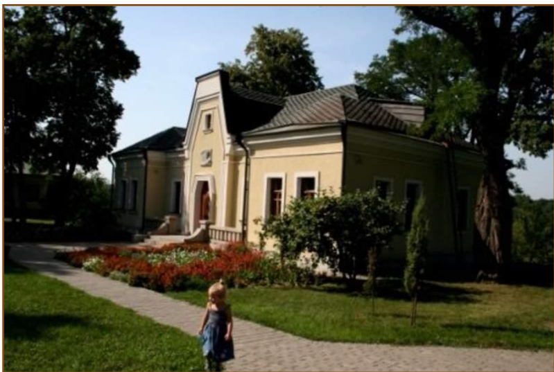
Садиба Енгельгардта, с. Будище на Черкащині