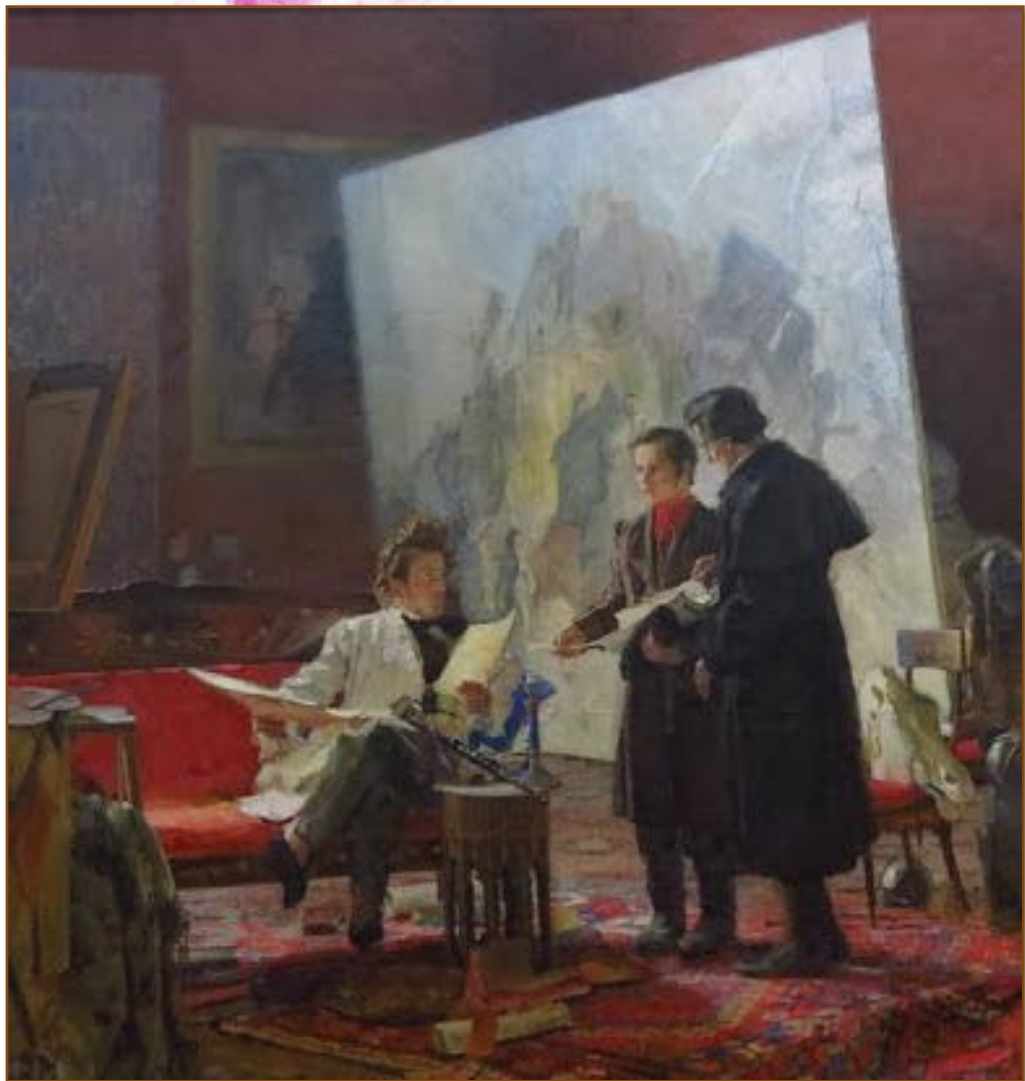
Г. Меліхов. «Молодий Т. Шевченко у майстерні К. Брюллова». 1939 р.

Видатні російські митці Карл Брюллов і Василь Жуковський викупили юнака з неволі та сприяли його вступові до Петербурзької академії мистецтв.