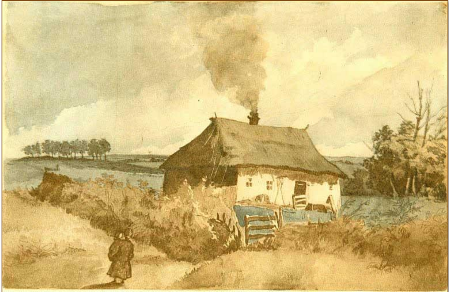
«На околиці». 1845 р.

Шевченко любив природу і малював чудові пейзажі.