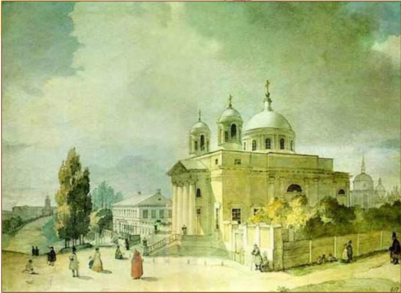
«Костьол у Києві». 1846 р.