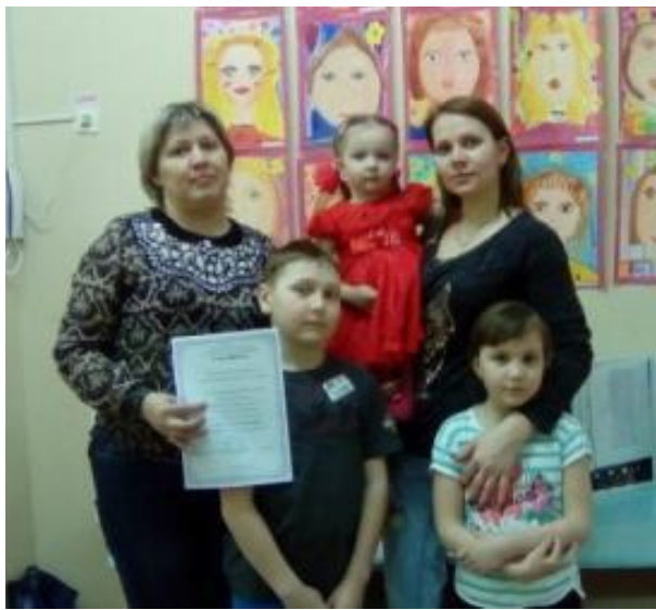
Министерство культуры Пермского края ГАОУ "Пермский краевой центр высокопедагогического воспитания и повышения квалификации работников и педагогов граждан (молодежи) в дошкольной службе"