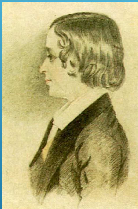
Старший сын, Александр Александрович Пушкин (1833-1914)г.