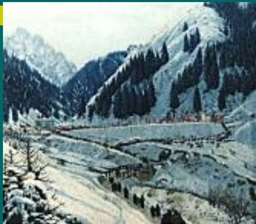
Биік таулы Медео мұз айдыны. 1954