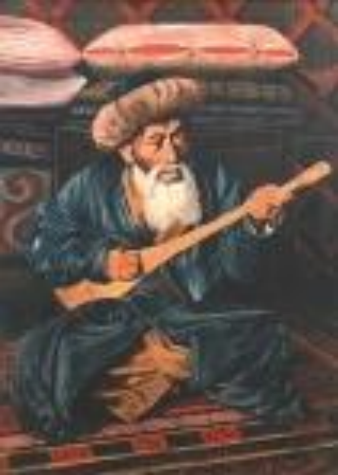
Жамбылдың портреті. 1973