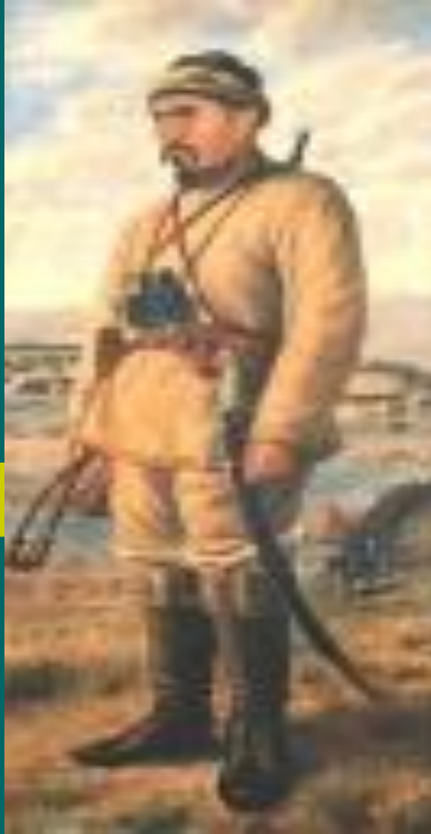
Амангелдінің портреті. 1940