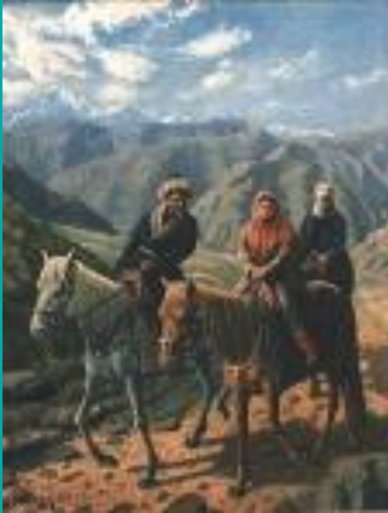
Қалыңдықты ұзату. (Сатып алынған қалыңдық). 1938