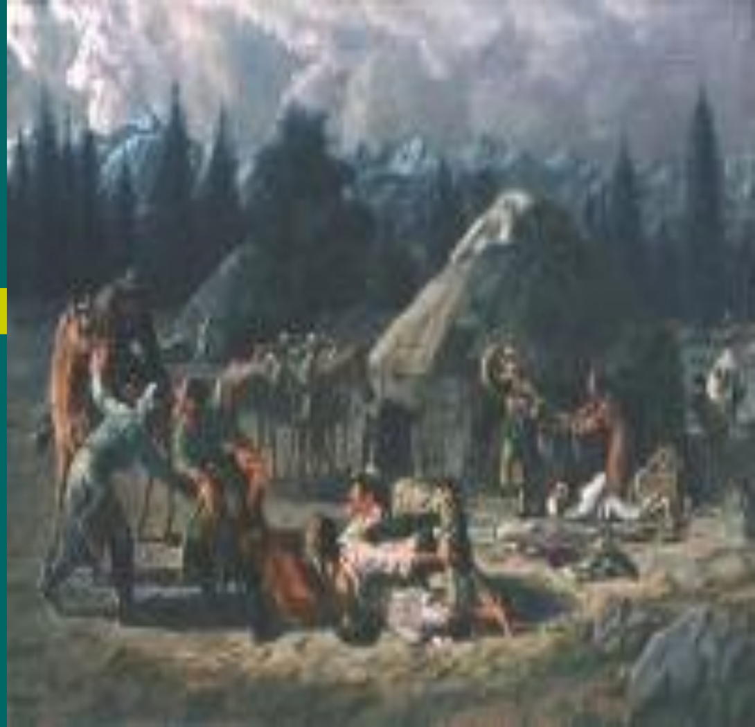
Қызды еріксіз алып қашу. 1937