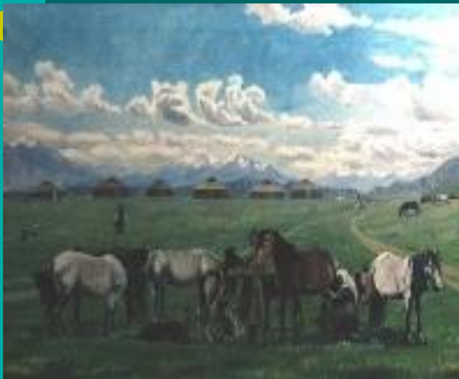
Бие сауу. 1936