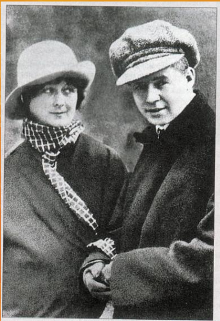
Есенин и Айседора Дункан, 1922