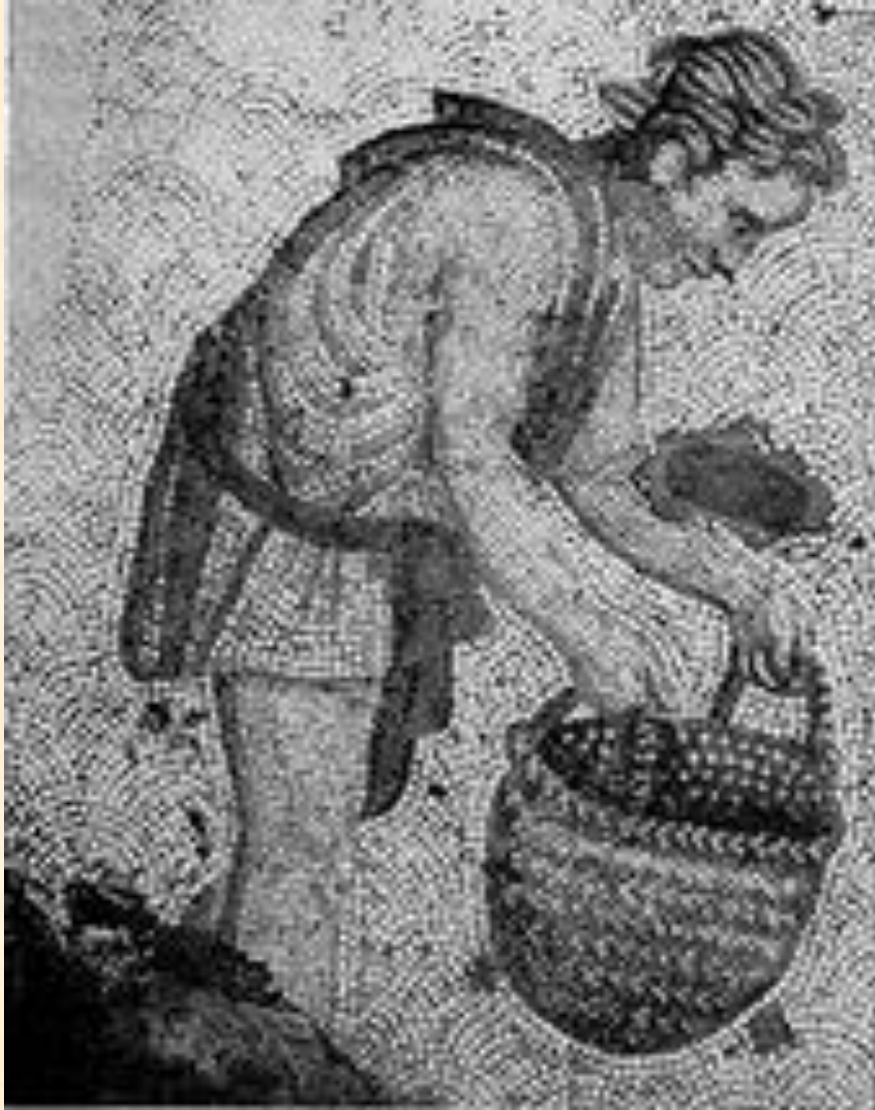
Фрагмент мозаичного пола Большого дворца императоров Константинополе. 5 в.