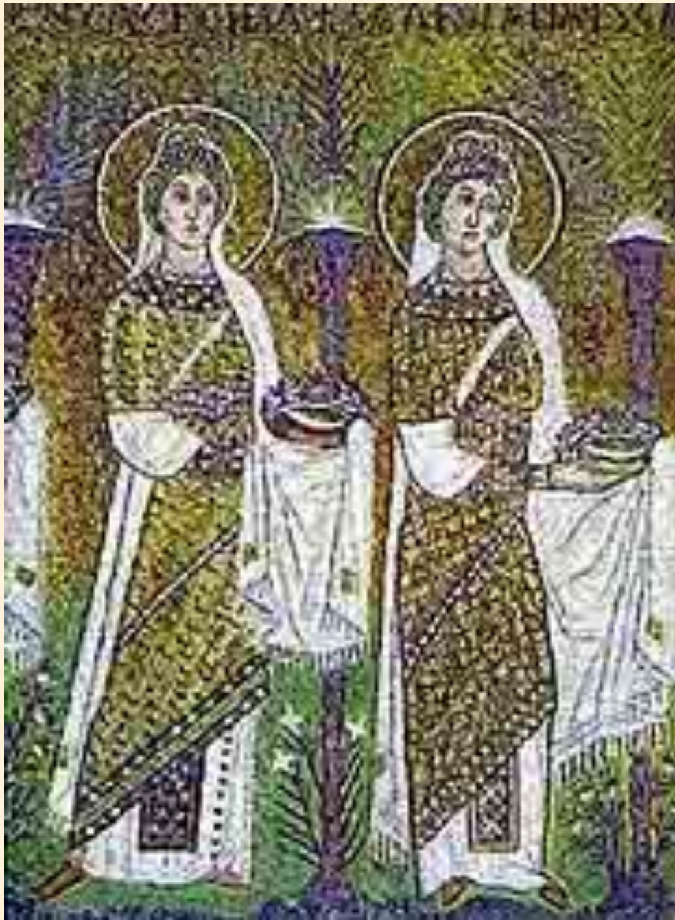
Мозаики храма Аполлинария Нуово в Равенне